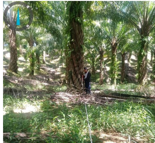
Pengukuran jarak tanam kelapa sawit