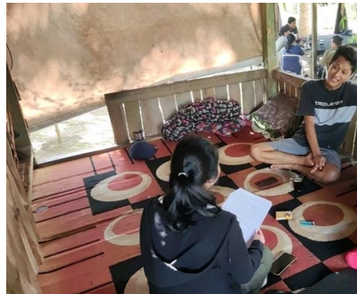
Wawancara dengan petani yang mengelola tegakan jati