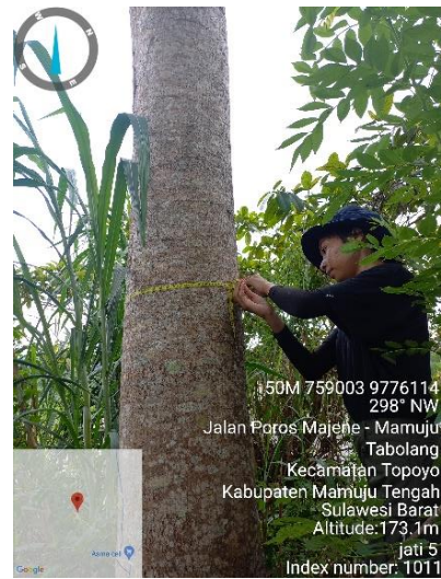
Pengukuran Diameter Pohon