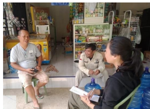
Wawancara dengan petani yang mengelola tegakan sengon