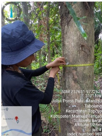
Pengukuran diameter pohon