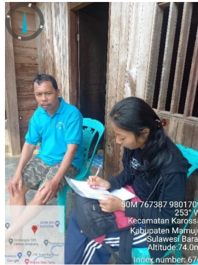
Wawancara dengan petani yang mengelola tegakan Jabon