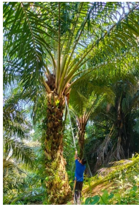
Pemangkasan pelepah sawit