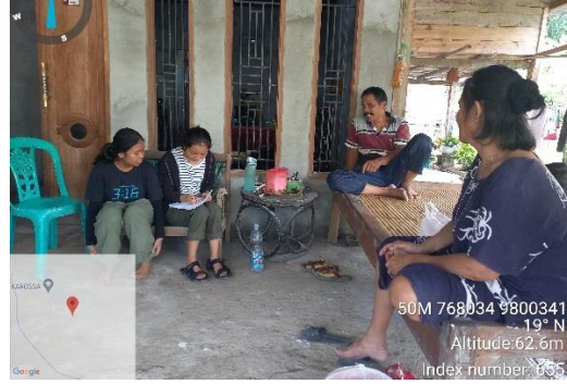
Wawancara dengan petani kelapa sawit