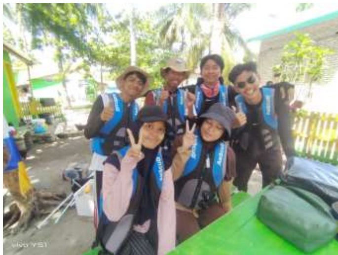
Lampiran 16. Dokumentasi Bersama Kepala Balai TN Taka Bonerate dan Jejerannya