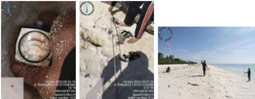
Lampiran 15. Dokumentasi Tim