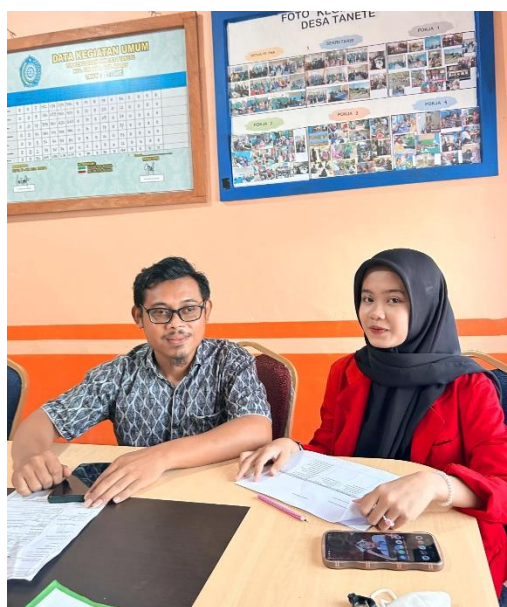
Wawancara bersama Kepala Dusun Bukkamata Desa Tanete, Kecamatan Simbang, Kabupaten Maros pada tanggal 10 Juni 2024