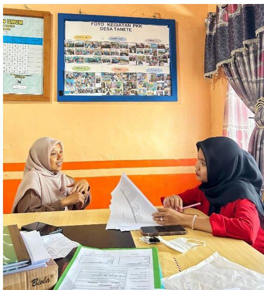
Wawancara bersama Ketua Forum (Kelompok konstituen) Desa Tanete, Kecamatan Simbang, Kabupaten Maros pada tanggal 10 Juni 2024