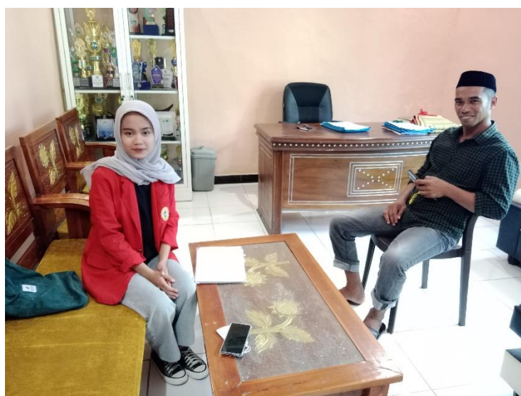
Wawancara bersama Kepala Desa Tanete, Kecamatan Simbang, Kabupaten Maros pada tanggal 19 Juni 2024