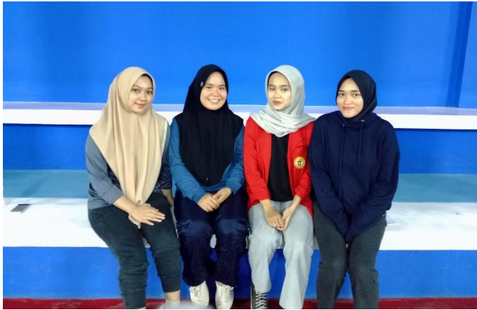
Wawancara bersama Masyarakat Umum pada tanggal 19 Juni 2024