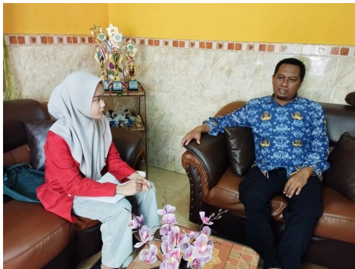
Wawancara bersama Badan Permusyawaratan Desa Tanete pada tanggal 19 Juni 2024