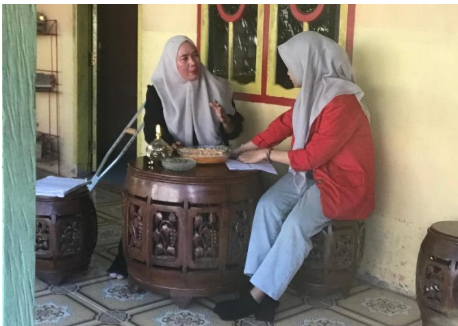
Wawancara bersama Masyarakat Umum (Penyandang Disabilitas) pada tanggal 21 Juni 2024