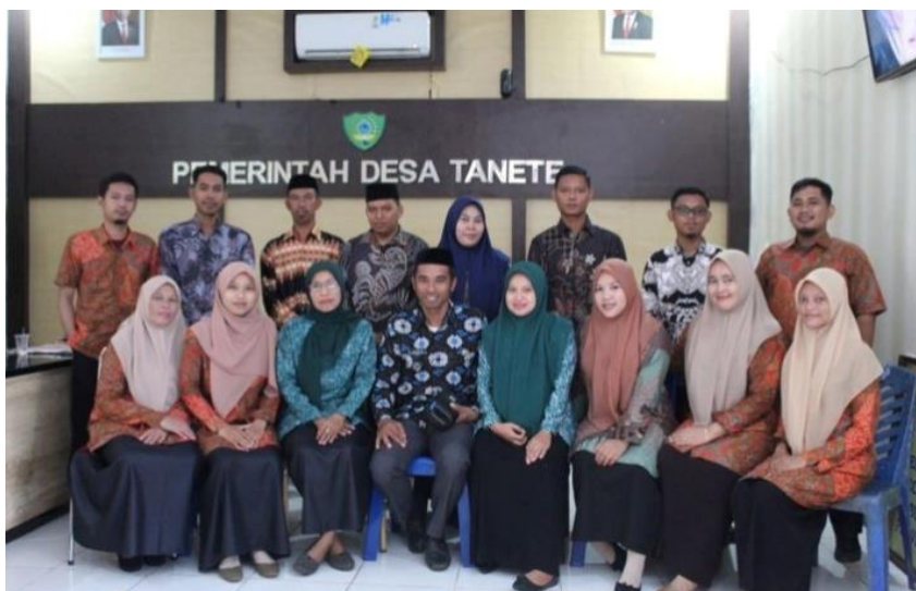
Pemerintah Desa Tanete, Kecamatan Simbang, Kabupaten Maros