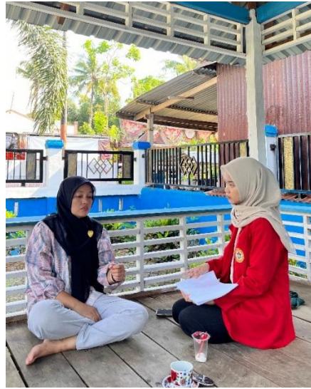
Wawancara bersama Pendamping Desa pada tanggal 11 Juni 2024