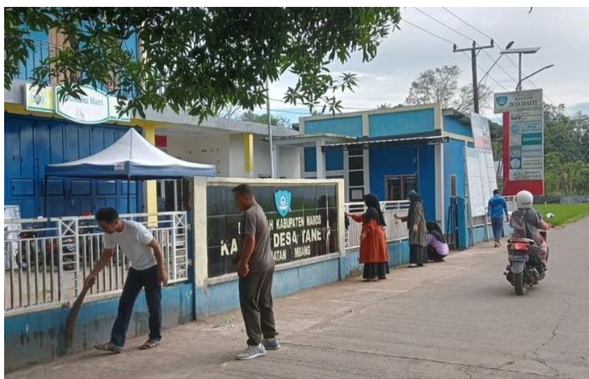
Kantor Desa Tanete, Kecamatan Simbang, Kabupaten Maros