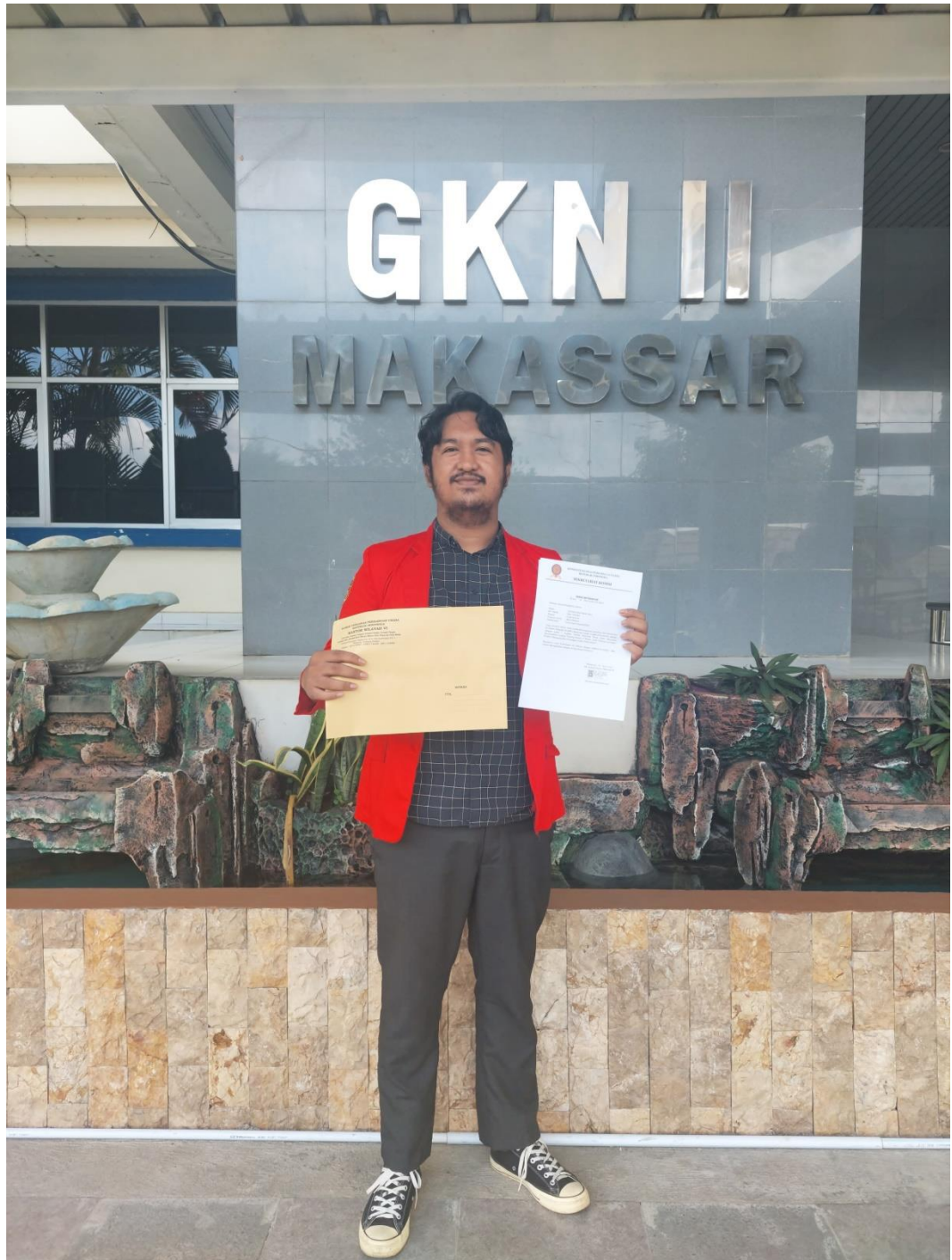
Dokumentasi penerimaan surat izin penelitian yang diberikan oleh pihak kantor KPPU Wilayah VI Makassar, pada tanggal 2 April 2024