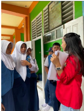
Penjelasan kepada responden