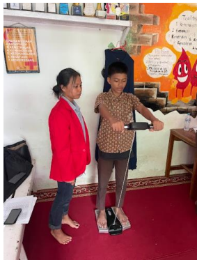
Pengukuran berat badan