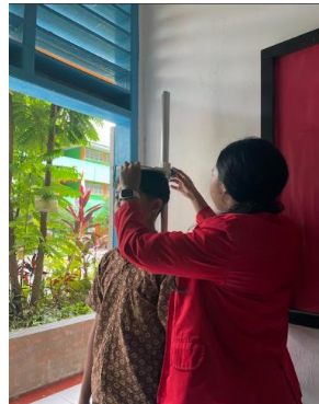
Pengukuran tinggi badan