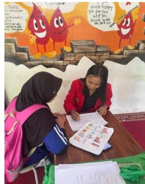
Wawancara kuesioner SQ-FFQ