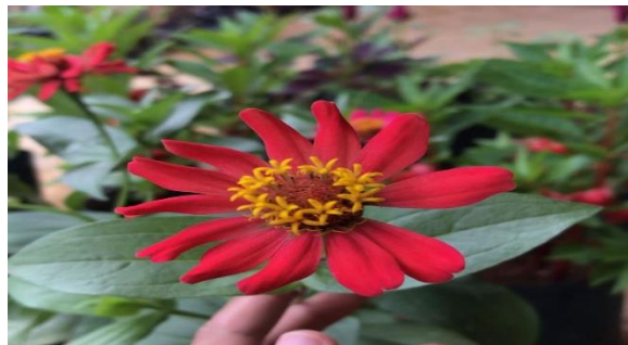
Gambar 2. Bunga Kertas Zinnia elegans Jacq

Bunga kertas Zinnia elegans merupakan memiliki akar tunggang. Batang berbentuk bulat. Daunnya melebar, berbentuk bulat hingga memanjang. Mahkota bunga berwarna putih kekuningan, kuning, atau jingga, merah, dan lainnya, termasuk bunga majemuk dan bunga tidak lengkap. Biji berwarna hitam mengkilap, berbiji dua atau satu. Tangkai putik pendek dan kepala putiknya miring. Zinnia elegans yang ditemukan berwarna merah muda dan putih (Nurmalasari dkk, 2020).