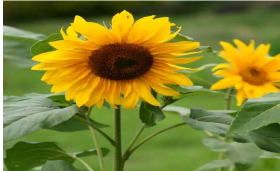
Gambar 1. Bunga Matahari Helianthus annuus L

panjang. Mahkota bunga berwarna kuning, bunga majemuk terdiri dari banyak kelopak bunga kecil dalam satu bonggol. Biji keras, berbentuk pipih, dan berwarna keabuan. Alat reproduksi terdiri dari 2 bunga yaitu bunga pita (bunga mandul, hanya memiliki putik sari) dan bunga tabung (bunga banci, memiliki benang sari dan putik) (Rahmadhani dkk, 2020).