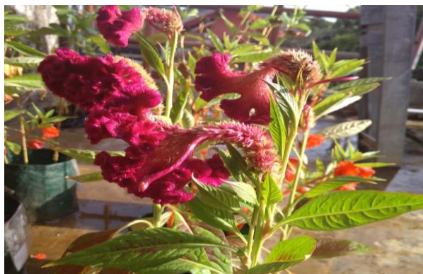
Gambar 3. Bunga Jengger Ayam Celosia argentea L.

Bunga Jengger Ayam berakar tunggang, batang berbentuk bulat, gundul, dan alur kasar memanjang. Daunnya tunggal letak berseling, dan bertangkai pendek. Mahkota bunga berwarna merah ataupun kuning, termasuk bunga majemuk, mahkota berbentuk bulat dan silindris. Biji berbentuk seperti ginjal, kecil, dan berwarna hitam mengkilap (Nurmalasari dkk, 2020).