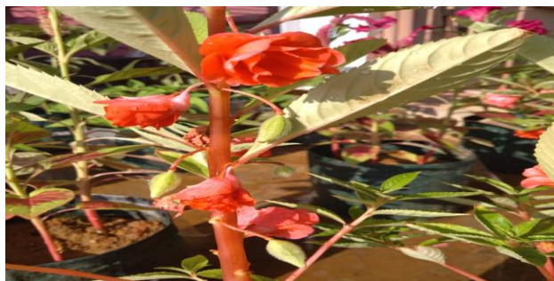
Gambar 4. Bunga Pacar Air Impatiens balsamina L (Dokumentasi Pribadi)

Tanaman pacar air termasuk suku Balsaminaceae yang sangat mudah tumbuh dipekarangan rumah. Tanaman ini ditemukan belahan bumi utara, India dan di daratan Asia Tenggara termasuk Indonesia. Tumbuhan pacar air berperawakan terna atau herbaceus. Tumbuhan ini memiliki tinggi kurang lebih 30-85 cm, berbatang basah dengan bentuk irisan melintang bulat/teres. Permukaan batangnya licin yang tumbuh tegak lurus, arah tumbuh cabang juga tegak lurus. Memiliki daun penumpu dan ligula. Berwarna merah, putih, merah muda, dan, ungu, Bijinya berwarna hitam dan berbentuk menyerupai bola, sedangkan buahnya berbentuk kapsul berwarna hijau, penuh dengan bulu-bulu halus (Izza dan Maisuna, 2021).