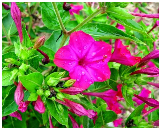
Gambar 5. Bunga Pukul Empat Mirabilis jalappa L

Mirabilis jalappa L. (bunga pukul empat) merupakan tanaman hias yang mudah tumbuh tanpa banyak perawatan. Mudah tumbuh di tanah yang mengandung cukup unsur hara dan terlindung dari sinar matahari. Meskipun demikian tanaman ini sering dijumpai tumbuh pada lahan kering dan terkena sinar matahari langsung. Banyak dibudidayakan karena keindahan warna dan ornamentasi bunganya, berkasiat obat, meskipun masih jarang penggunaanya (Irianto dkk, 2007).