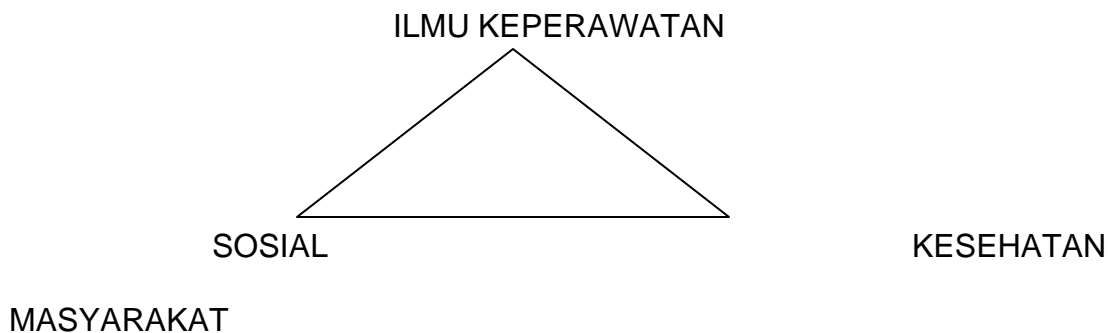
Gambar 1 – 1. Komponen dasar dalam ilmu keperawatan kesehatan Masyarakat.

Tiga komponen dasar dalam ilmu keperawatan kesehatan masyarakat :