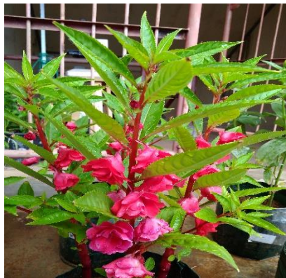
Gambar 5 Bunga Pacar Air Impatiens balsamina L. (Dokumentasi Pribadi, 2022).

Pacar air Impatiens balsamina L. adalah tumbuhan yang berasal dari Asia Selatan dan Asia Tenggara. Tumbuhan pacar air cukup mudah ditemui di Indonesia. Tumbuhan ini adalah tanaman tahunan atau dua tahunan dan memiliki bunga yang berwarna putih, merah, ungu, atau merah jambu. Bentuk bunganya menyerupai bunga anggrek yang kecil. Tinggi tumbuhan ini bisa mencapai satu