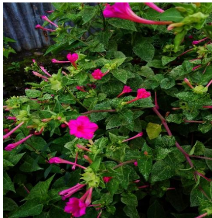
Gambar 4 Bunga Pukul Empat Mirabilis jalapa L. (Dokumentasi Pribadi, 2022).

Mirabilis jalapa L. adalah semak yang dapat tumbuh sampai tinggi 1 meter. daun berbentuk hati, panjang 3-12 cm, bunganya biseksual, warnanya merah, pink, kuning, atau putih dan berkembang menjelang sore. Buahnya hitam dan bulat, berdiameter 5-8 mm. Berbatang basah, daunnya berbentuk jantung warna hijau tua panjang 2-3 cm, lebar 8 mm, pangkal daun membulat, ujung meruncing tepi daun rata letaknya berhadapan, mempunyai tangkai daun yang panjangnya 6 cm, bunganya berbentuk terompet dengan banyak macam warna antara lain : merah, putih, jingga, kuning, kombinasi/belang-belang, mekar pada saat sore hari