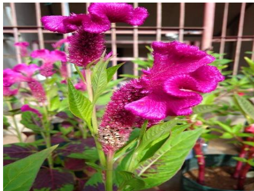
Gambar 6 Bunga Jengger Ayam Celosia argentea L.

Bunga jengger ayam termasuk ke dalam Famili Amaranthaceae. Tanaman ini dikenal dengan nama-nama daerah seperti bayam ekor belanda, bayam kucing.