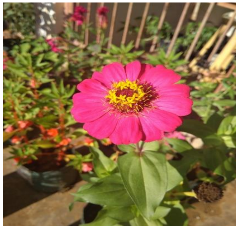
Gambar 3 Bunga Kertas Zinnia elegans Jacq (Dokumentasi Pribadi, 2022).

Zinnia elegans Jacq merupakan bunga yang berasal dari Meksiko. Walaupun berasal dari Meksiko, bunga ini termasuk yang mudah dibudidayakan di Indonesia sebagai tanaman hias. Bunga kertas termasuk dalam suku Asteraceae . Bunga kertas yang ditemukan di Indonesia pada umumnya memiliki bentuk dengan bunga pita satu lapis (tidak pompom) dan berwarna krem atau pink tua (Utomo, 2018).