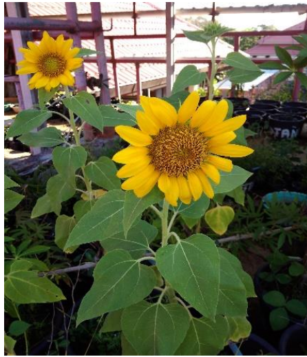
Gambar 2 Bunga Matahari Helianthus annuus L. (Dokumentasi Pribadi, 2022).

Bunga matahari merupakan tanaman yang memiliki beberapa manfaat diantaranya sebagai bahan membuat sabun, lilin, pernis, cat serta pelumas dan tergolong tanaman hiperakumulator yang bersifat toleran terhadap kontaminan. Bunga matahari merupakan tanaman cepat tumbuh dengan produksi biomasa yang tinggi sehingga dapat dimanfaatkan untuk fitoremediasi (penyerapan) logam-logam beracun (Cu, Zn, Pb, Hg, As, Cd, dan Ni) pada tanah yang terkontaminasi (Jadia dan Fulekar, 2008). Bunga matahari juga mampu mengakumulasi Cr sebesar 369,15 hingga 3334 mg Cr/kg berat kering pada bagian akar dan 164,47-995,15 mg Cr/kg berat kering pada bagian batang sampai daun (Utomo, 2018).