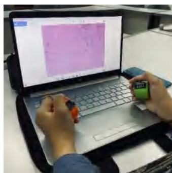
Ket. Menghitung Hasil Evaluasi Spermatozoa