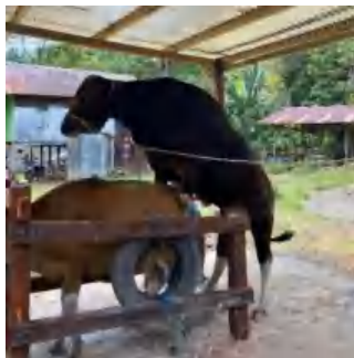
Ket. Penampungan Semen Sapi Bali Polled