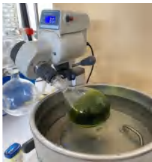
Ket. Pembuatan Ekstrak Daun Katuk