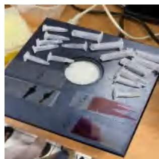
Ket. Viabilitas, MPU, TAU