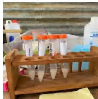
Ket. Pembagian 4 Perlakuan Semen Segar Sapi Bali Polled