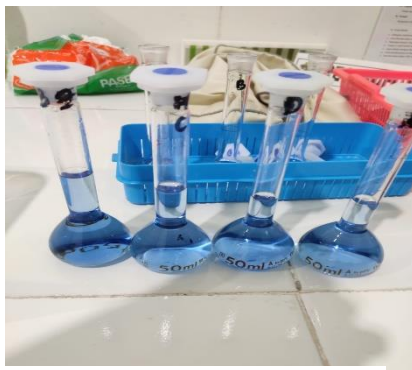
(9) Penghomogenan larutan