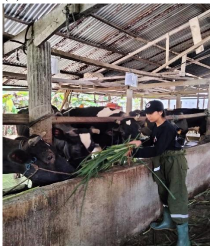
(5) Pemberian Rumput