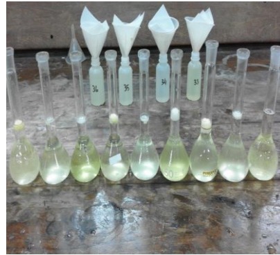
(8) Proses Penyaringan