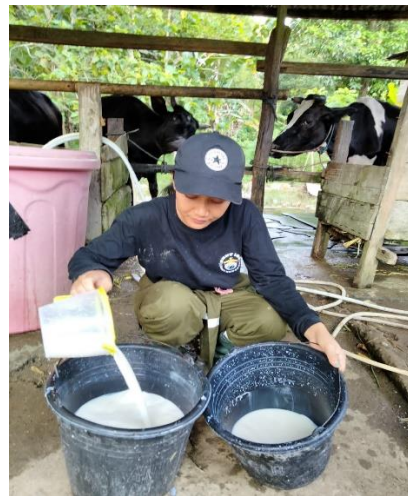
(4) Pengambilan Susu