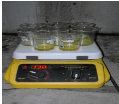
(7) Proses Ekstraksi