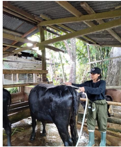
(2) Pemandian Sapi Perah