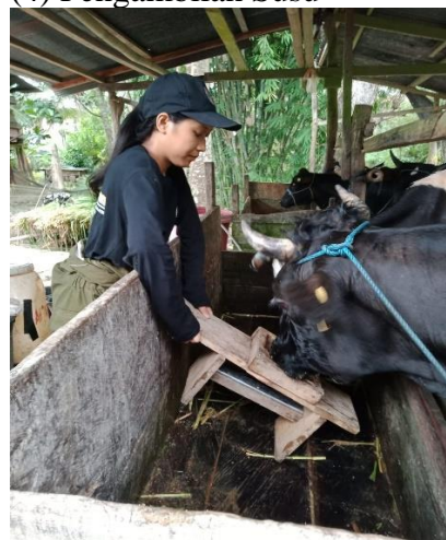
(6) Pemberian UMMB