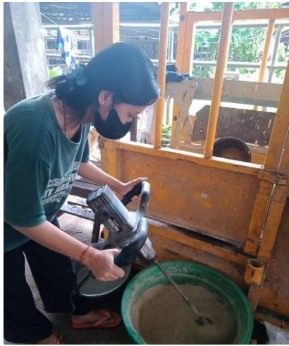
(1) Pembuatan UMMB