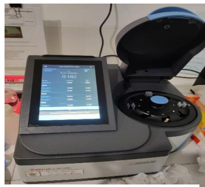
(10) Pengamatan Hasil