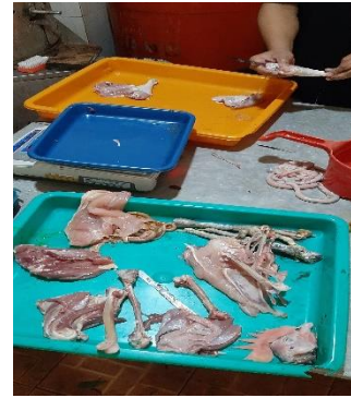
Keterangan : Proses Pemisahan Daging dan Tulang