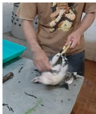
Keterangan : Proses Penyembelihan dan Pencabutan Bulu