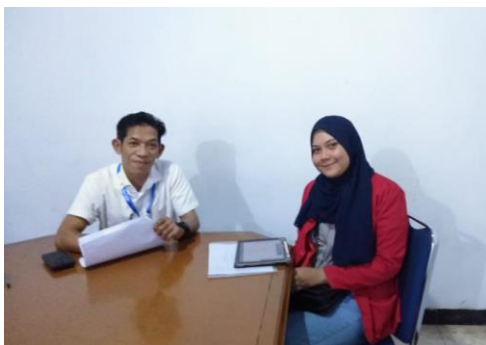
Wawancara bersama Kepala UPTD PPA