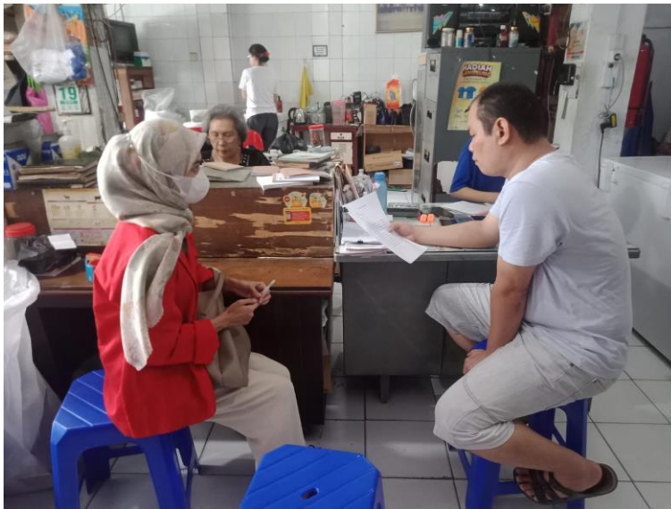
Dokumentasi 1. Wawancara Bersama Layer Integrator