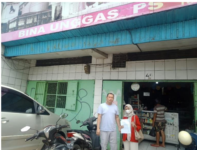
Dokumentasi 4. Kunjungan Ke Poultry Shop milik Layer Integrator