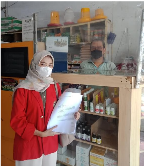
Dokumentasi 2. Wawancara Bersama Layer Integrator