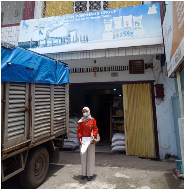
Dokumentasi 3. Kunjungan Ke Poultry Shop milik Layer Integrator