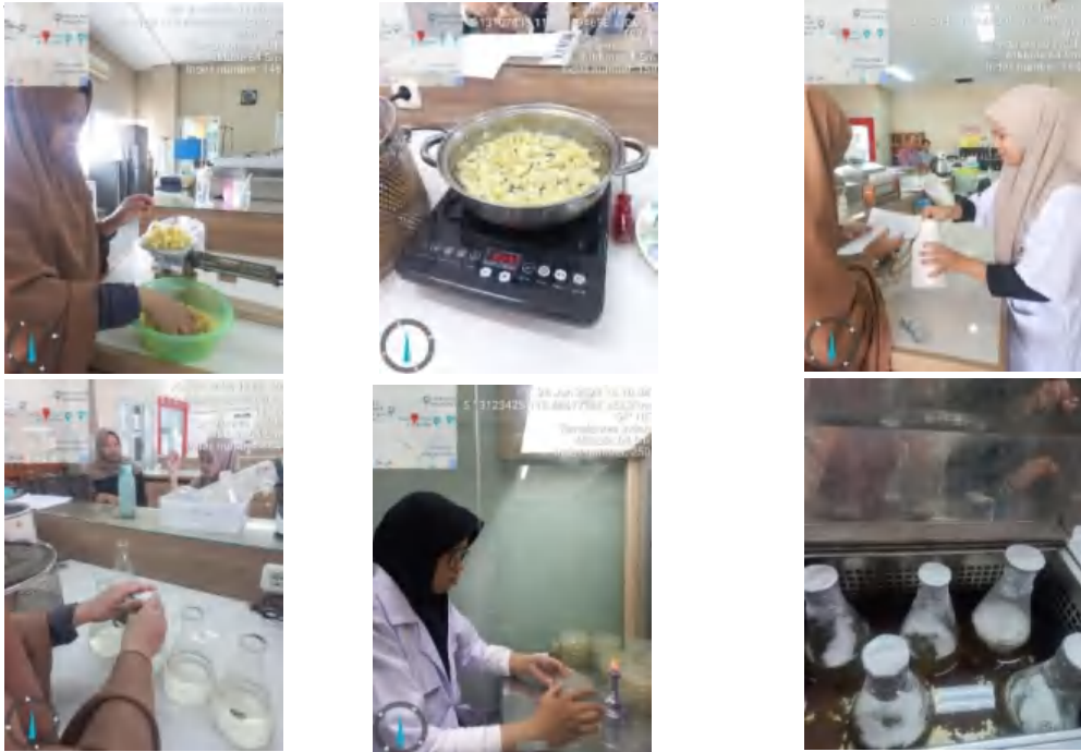
Gambar Lampiran 2. Pembuatan suspensi B. bassiana untuk perlakuan perendaman.