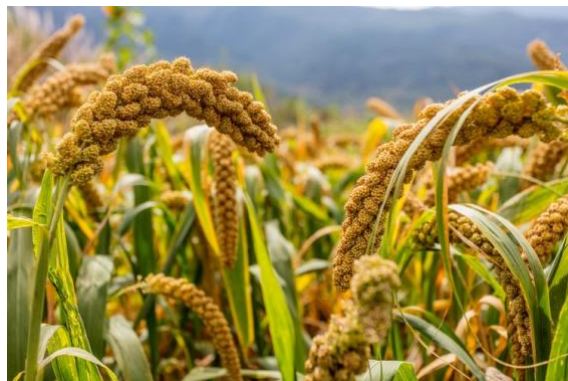
Gambar 1. Tanaman Jewawut ( Setaria italica L.)

Tepung jewawut merupakan tepung yang berasal dari biji jewawut yang dihaluskan. Jewawut ( Setaria italica L.) termasuk jenis sereal atau rumput-rumputan yang sering disebut dengan nama foxtail millet karena malainya berbentuk seperti ekor rubah. Secara sekilas, tanaman jewawut hampir menyerupai gandum dengan tinggi mencapai 120 cm, batang yang kecil, dan daun yang panjang. Ukuran biji jewawut kecil dan terdiri dari berbagai warna yaitu kuning, keabuan, dan ada pula yang merah (Juhaeti et al., 2019). Jewawut merupakan tanaman yang mudah tumbuh pada berbagai jenis tanah seperti tanah yang kurang subur dan kering, budidayanya mudah, masa panen yang singkat, serta memiliki banyak manfaat (Fitriani et al., 2013). Proses pembuatan jewawut menjadi tepung terdiri dari beberapa proses yaitu perendaman, penyosohan, pencucian, pengeringan, penghalusan, dan pengayakan. Jewawut yang diolah menjadi tepung akan memiliki masa simpan yang panjang, praktis, dan mudah digunakan untuk membuat berbagai macam produk pangan seperti pasta, roti, dan cookies (Sulistyaningrum et al., 2017). Tanaman jewawut dapat dilihat pada Gambar 1.