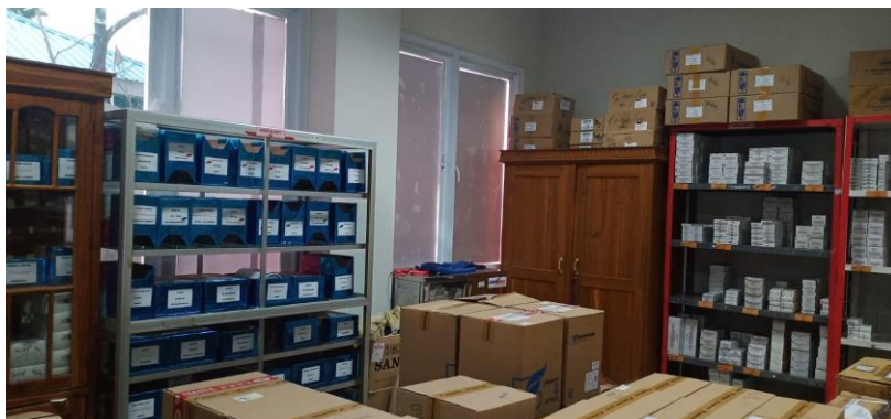
Gudang penyimpanan obat narkotik dan psikotropik