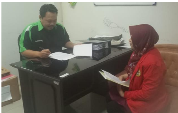
Wawancara bersama Kepala bagian manajemen kesuangan