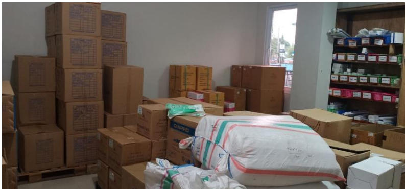
Gudang penyimpanan alat kesehatan dan BMHP