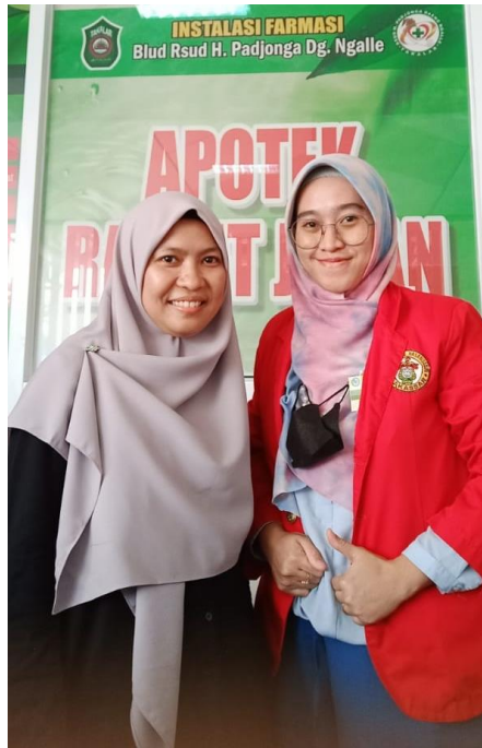
Wawancara bersama Kepala bagian manajemen mutu kefarmasian