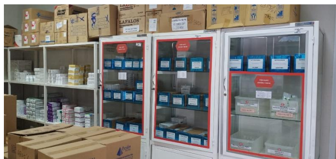
Gudang penyimpanan obat IFRS HPDN Kabupaten Takalar