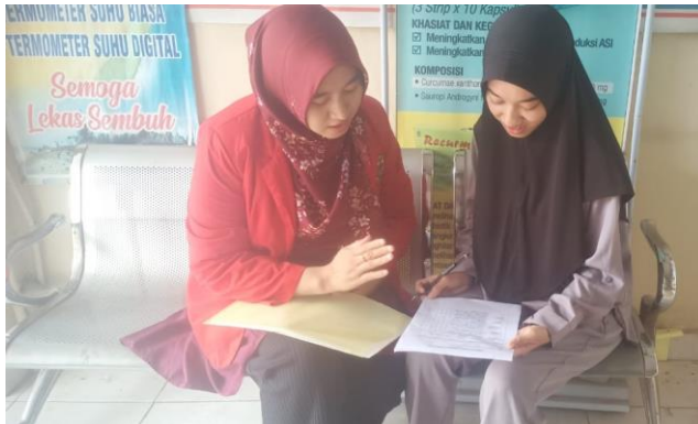
Wawancara bersama salah satu pasien apotek rawat jalan