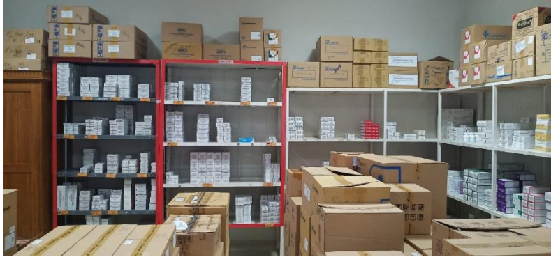
Gudang penyimpanan obat generik IFRS HPDN Kabupaten Takalar