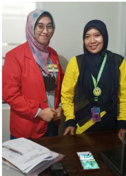
Wawancara bersama Kepala gudang perbekalan farmasi