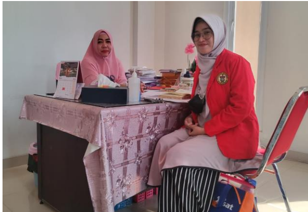
Wawancara bersama Kepala instalasi farmasi RSUD HPDN Kab. Takalar