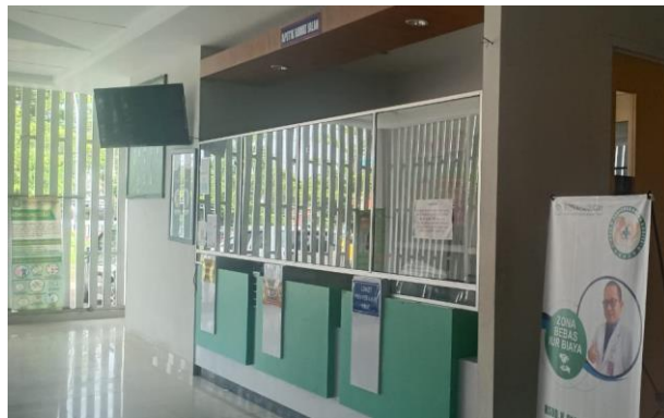
Apotek rawat jalan RSUD HPDN Kabupaten Takalar