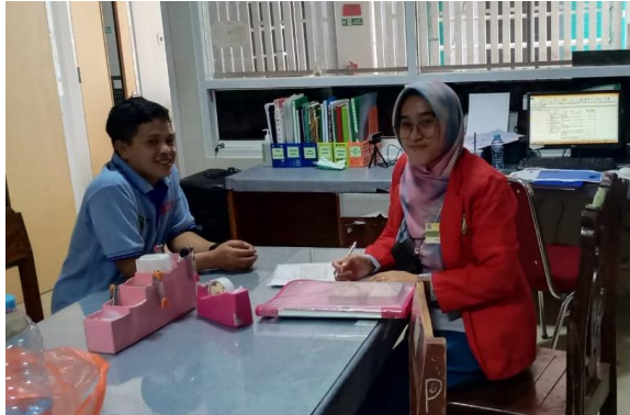
Wawancara bersama Kepala seksi penunjang medis