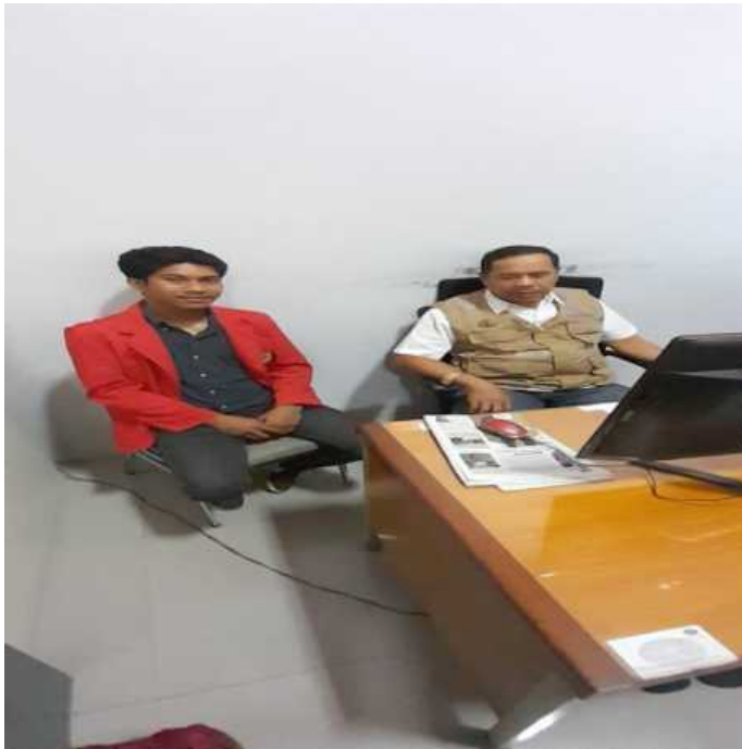
Wawancara Bersama Pegawai Bidang Kesiapsiagaan BPBD Kota Makassar