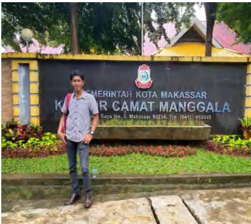
Kantor Camat Manggala