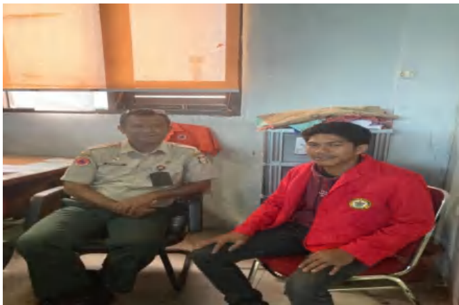
Wawancara Bersama Pengawai Bidang Kedaruratan dan logistic BPBD Kota Makassar