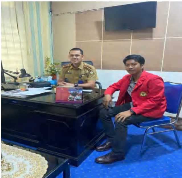
Wawancara Bersama Sekretaris Camat Manggala