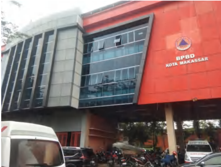
KANTOR BPBD KOTA MAKASSAR