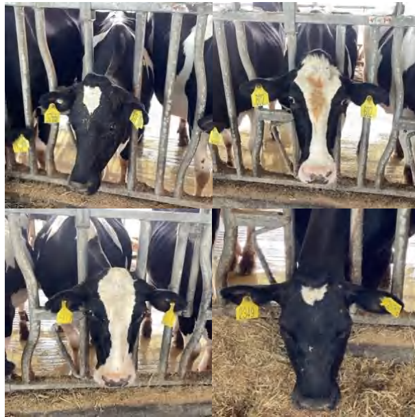
Sapi yang terinfeksi mastitis yaitu no. 411, 2349, 3766 dan 602.