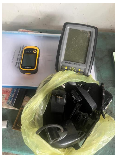
GPS dan Fish Finder