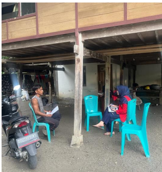
Sekretaris Kelompok Nelayan Tenggori