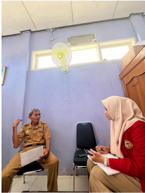
Kabid Perikanan Tangkap & Pesisir