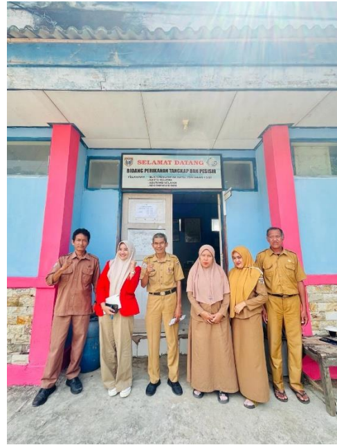
Staff Bid. Perikanan Tangkap & Pesisir