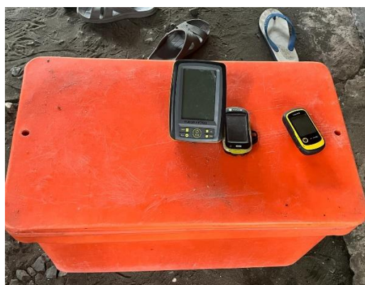
Coolbox, GPS dan Fish Finder