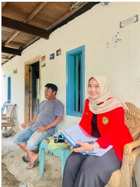
Ketua Kelompok Nelayan Culliry