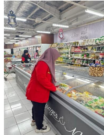
Foto produk olahan perikanan di supermarket kota Makassar