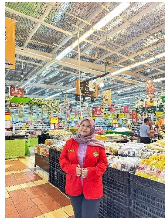
Foto di supermarket kota Makassar