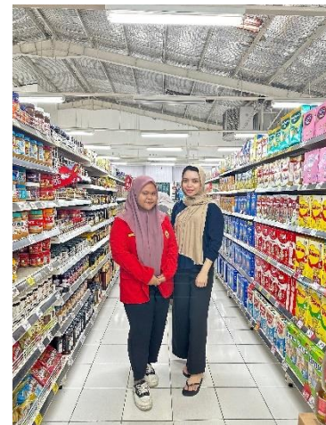
Foto produk olahan perikanan di supermarket kota Makassar