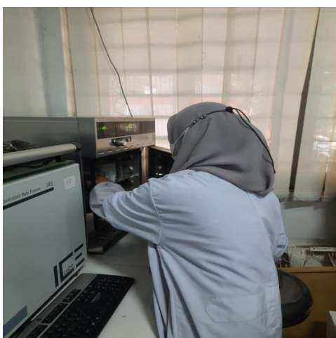
Ket: Proses Inkubasi