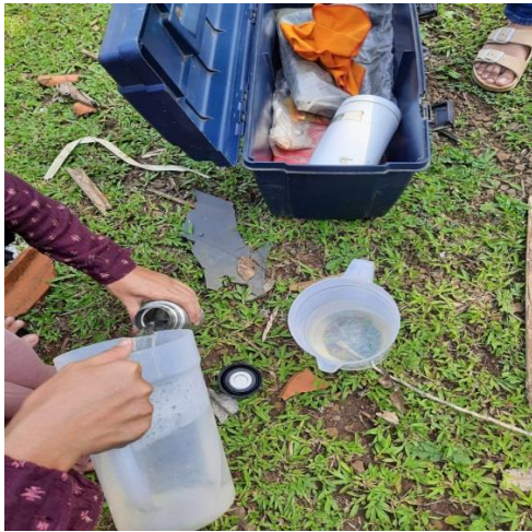
Ket: Persiapan Penampungan semen