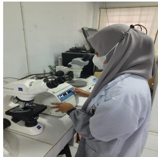
Ket: Proses Sentrifugasi