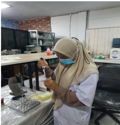
Ket: Pencampuran Larutan Host dan Formasaline