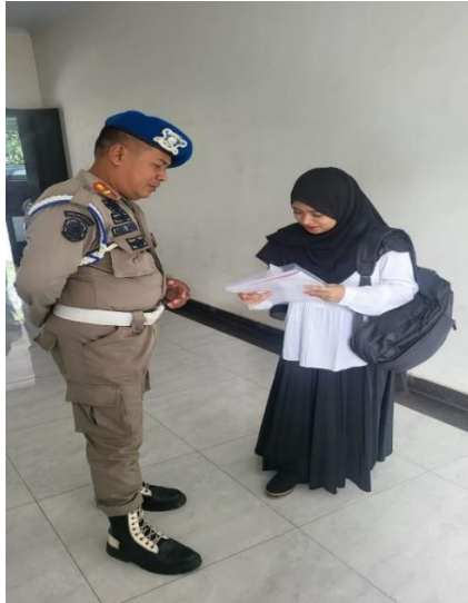
Pengecekan berkas-berkas penelitian