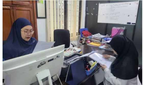
Bertemu dengan Kepala Bidang DISKOMINFO-SP