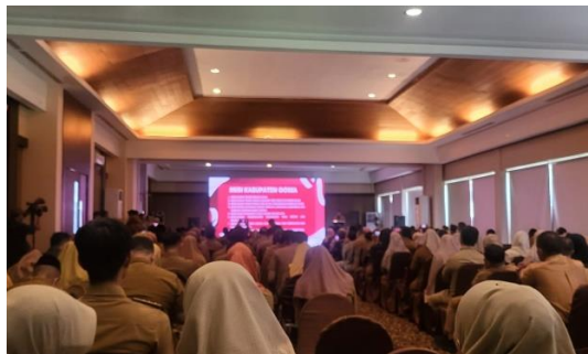
Mengikuti salah satu kegiatan pemerintahan, yang akan diliput dan diberitakan dalam website humas.gowakab.go.id