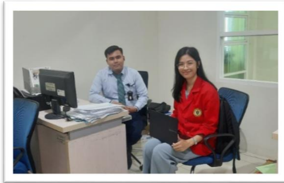
Wawancara dengan Asisten Administrasi Bank Pengembangan Daerah SulSelBar cabang Polewali