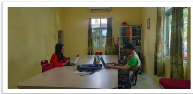
Wawancara dengan Kepala Dinas Lingkungan Hidup Kabupaten Polewali Mandar