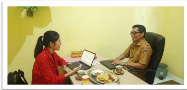
Wawancara dengan Direktur Bank Sampah Induk Sipamandaq