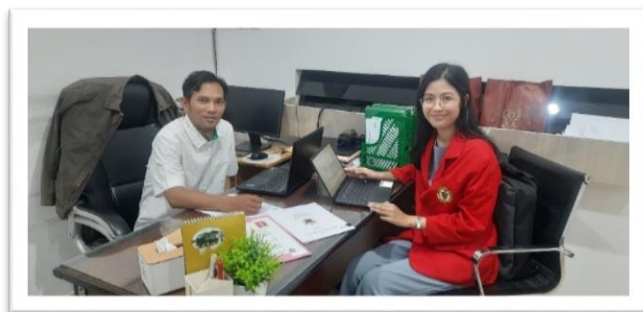
Wawancara dengan Kepala Pegadaian cabang Polewali