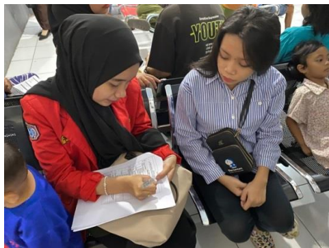
Pengumpulan Data di Puskesmas Somba Opu