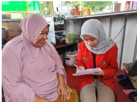
Pengumpulan Data secara Door to Door di Wilayah Kerja Puskesmas Somba Opu