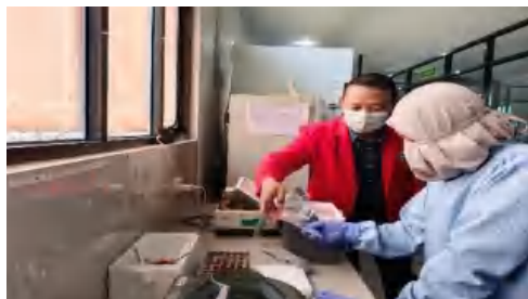
Pengiriman sampel serum darah ke BB Labkesmas Makassar