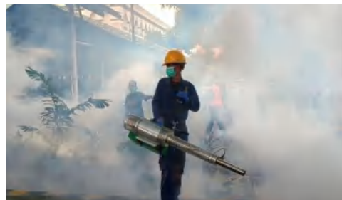
Proses kegiatan fogging dengan penggunaan APD lengkap