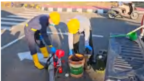
Proses pencampuran bahan insektisida dan pelarut