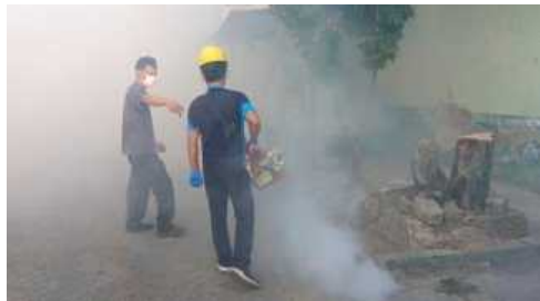
Petugas fogging yang masih belum menggunakan APD lengkap