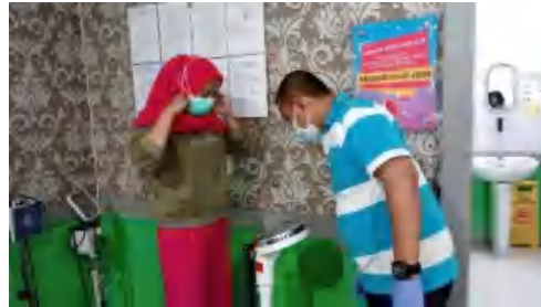
Pengukuran Berat Badan