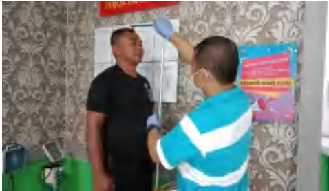
Pengukuran Tinggi Badan