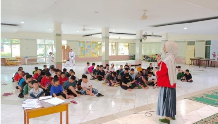
Memberikan penjelasan terkait tujuan dan teknis pelaksanaan penelitian kepada responden