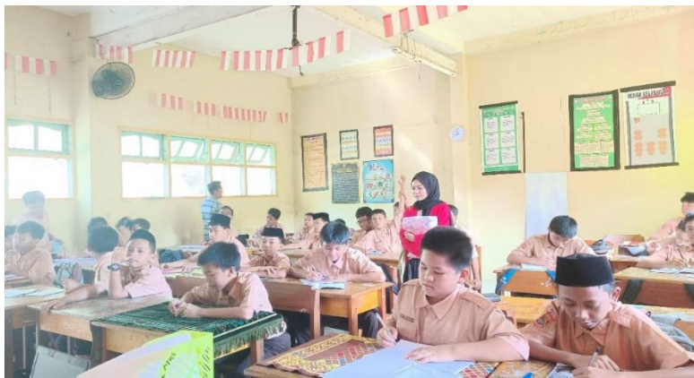
Pelaksanaan evaluasi ( post-test 1)