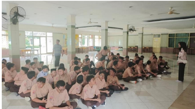
Pelaksanaan evaluasi ( post-test 1)