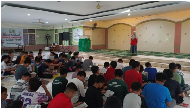
Pembagian dan penjelasan buku saku rapor Kesehatan (Proses Intervensi)