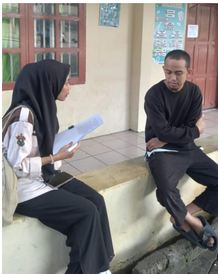
Wawancara bersama petugas asrama