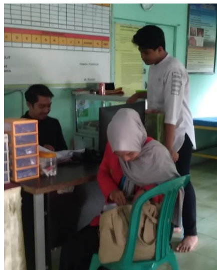
Wawancara Bersama petugas poskestren