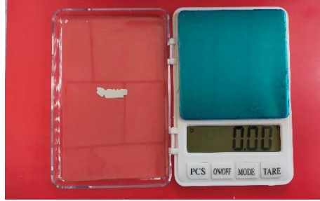
(Timbangan ketelitian 0,01)