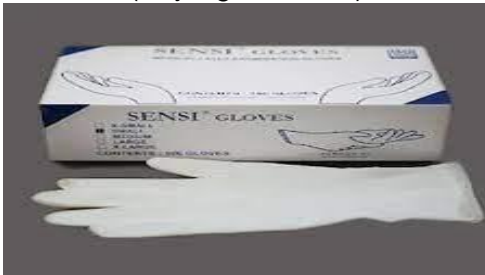
(Sarung tangan latex)