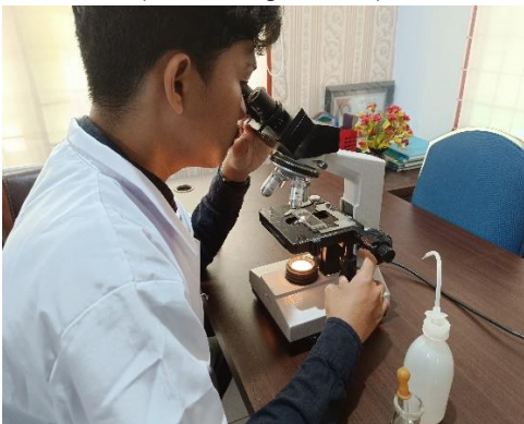
(Proses perhitungan fekunditas telur rajungan)