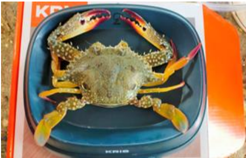
(Pengukuran berat tubuh rajungan)