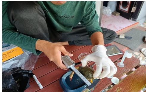
(Pengukuran lebar karapas)