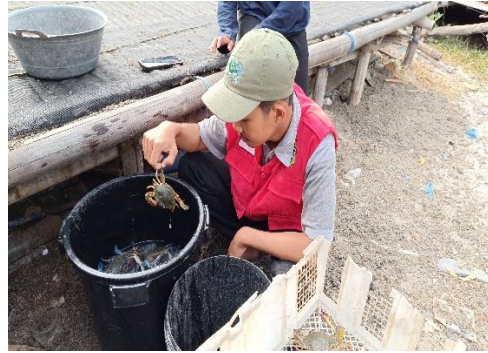
(Pemilihan rajungan betina)