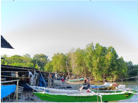
(Lokasi Pendaratan rajungan)