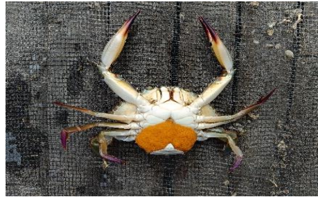
(Rajungan Betina Bertelur)