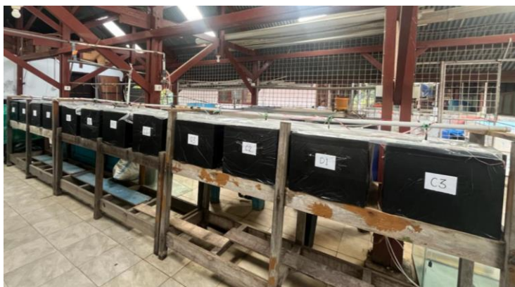
Gambar 2. Wadah penelitian yang digunakan

Wadah yang digunakan pada penelitian ini adalah akuarium berukuran 39 x 36 x 30 cm dengan volume maximum 42.120 cm 3 atau 42 L, sebanyak 12 buah akuarium, yang telah dilapisi plastik hitam di bagian sisi luar akuarium. Wadah penelitian dapat dilihat pada Gambar 2.