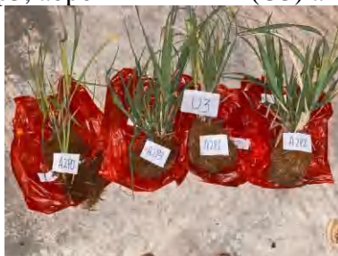
(U3) a2p0, a2p3, a2p1, a2p2