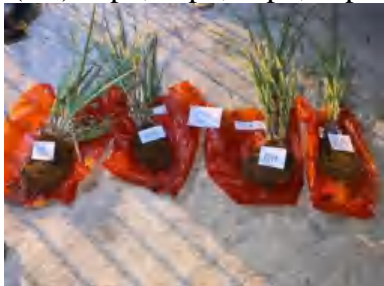
(U2) a1p2, a1p3, a1p1, a1p0