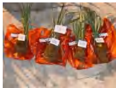
(U1) a2p0, a2p1, a2p3, a2p2