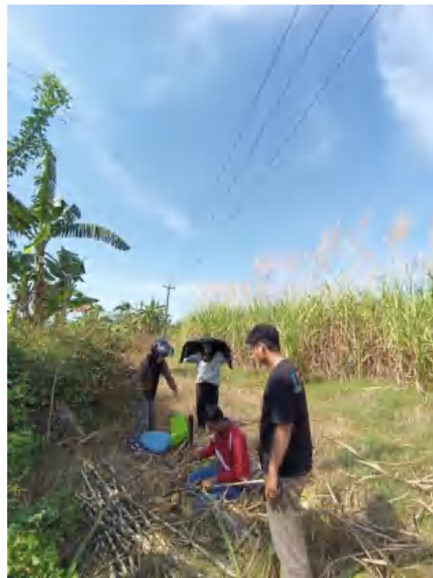
Gambar Lampiran 2. Pengambilan bibit tebu