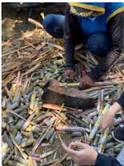
Gambar Lampiran 3. Pemotongan bud set tebu