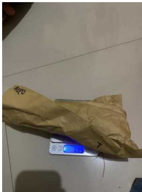
Gambar Lampiran 12. Pengukuran berat kering