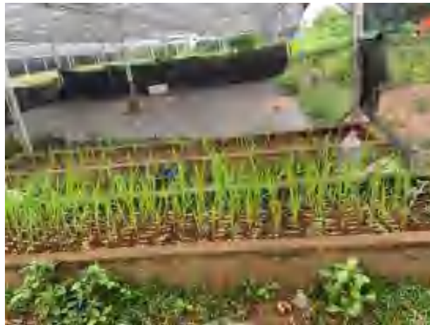
Gambar Lampiran 5. Bibit tebu 22 HST