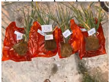
(U3) a0p2, a0p1, a0p3, a0p0