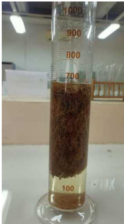
Gambar Lampiran 13. Pengukuran Volume Akar