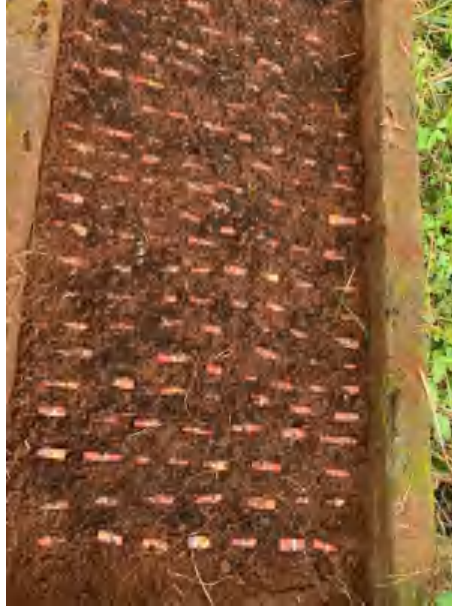
Gambar Lampiran 5. Penanaman bibit di media semai