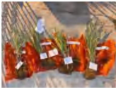
(U1) a1p3, a1p2, a1p0, a1p1