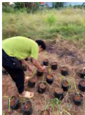
Gambar Lampiran 7. Pengaplikasian pupuk KNO_3