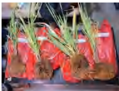
(U1) a0p0, a0p1, a0p2, a0p3