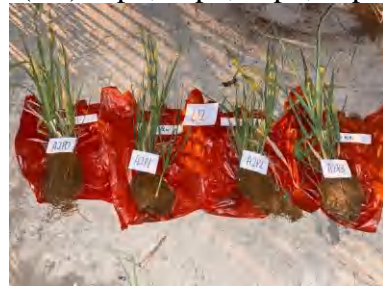
(U2) a2p0, a2p1, a2p2, a2p3