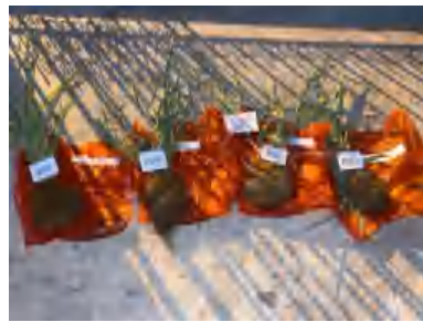
(U2) a0p0, a0p3, a0p2, a0p1