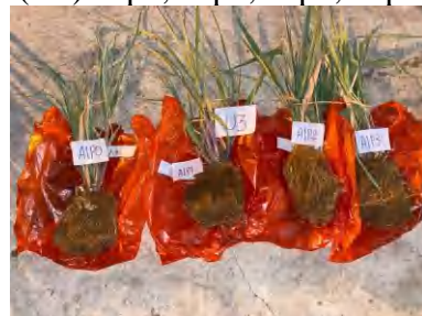
(U3) a1p0, a1p1, a1p2, a1p3