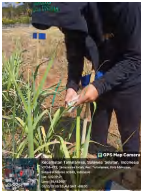
Gambar Lampiran 14. Pengukuran Klorofil pada Daun