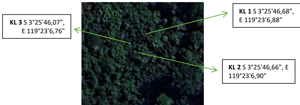
Lokasi Lahan Penelitian Kakao Langsung di Dusun Lemo Baru, Desa Kuajang, Kabupaten Polewali Manda