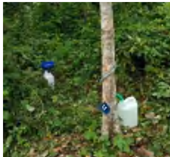
L1 (Throughfall dan Stemflow)

Lokasi Lahan Penelitian Langsung di Dusun Lemo Baru, Desa Kuajang, Kabupaten Polewali Mandar