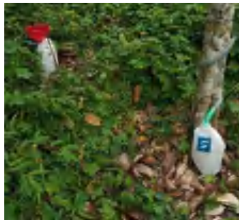
L3 (Throughfall dan Stemflow)