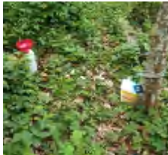
L2 (Throughfall dan Stemflow)