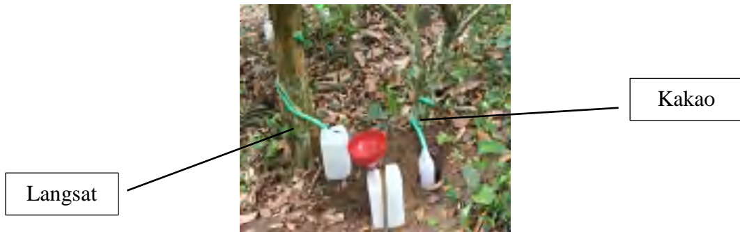
Ulangan 2 (Throughfall dan Stemflow)