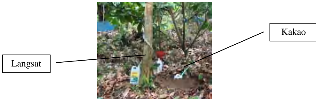
Ulangan 1 (Throughfall dan Stemflow)