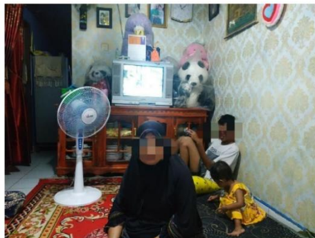
(Informan AM beserta cucu dan anaknya yang mengalami keterbelakangan mental)