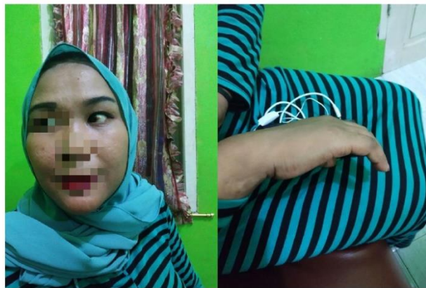
(Bekas KDRT di badan SIS, kejadian pemukulan sekitar 1 minggu sebelumnya)