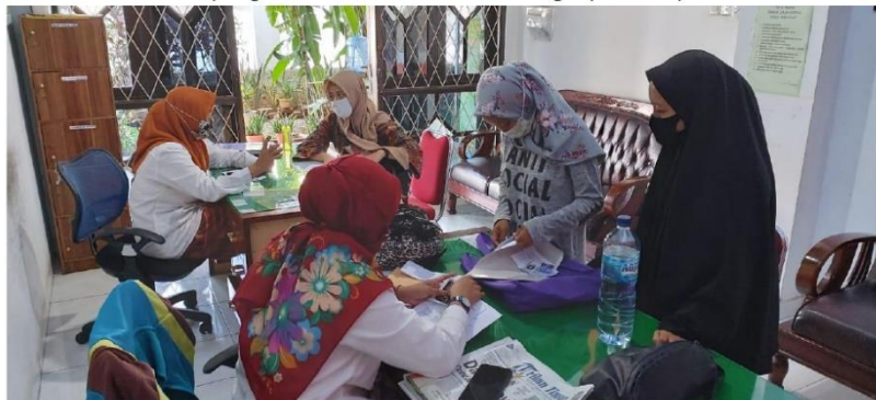
(Pengambilan data dan wawancara dengan pihak UPT)