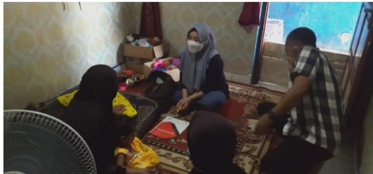
(Pengambilan data di rumah AM yang mengenakan kerudung hitam, didampingi oleh Pak RW, ibu RT dan pihak Rumah Aman)