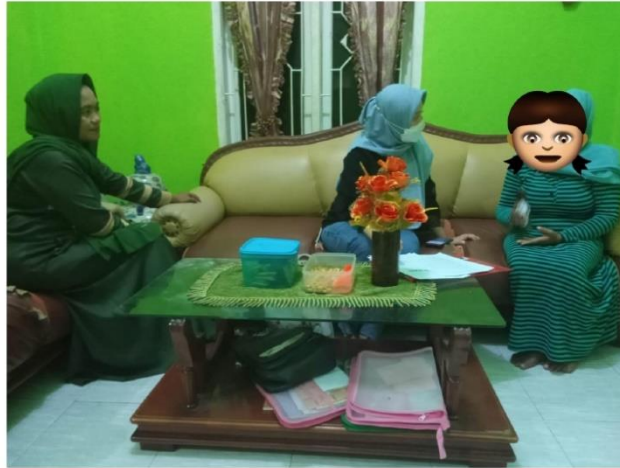
(Informan SIS. Pengambilan data dilakukan di kediaman pendamping rumah aman)