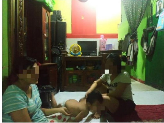
(Pengambilan data penelitian di rumah informan IND, beserta pendamping rumah aman dan pihak keluarga)