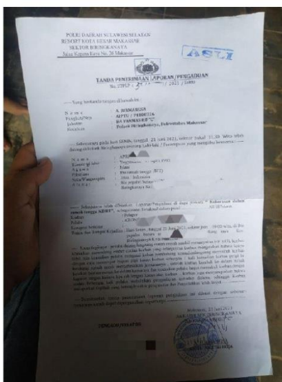
(Lampiran berkas pengaduan di kepolisian terkait KDRT yang dialami)