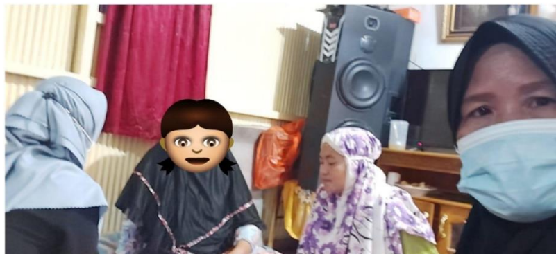
(Pengambilan data penelitian di rumah informan YAN, beserta pendamping rumah aman)