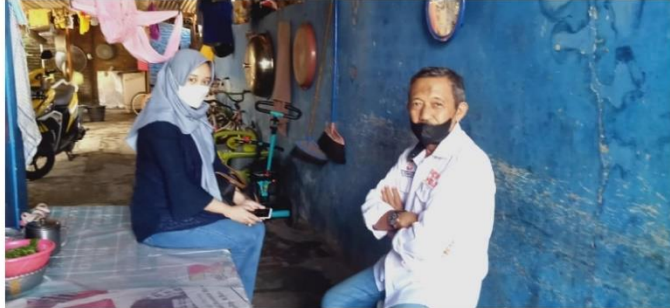
(Pengambilan data di rumah AM, didampingi Bpk Syaiful pendamping Rumah Aman)