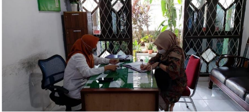
(Pengambilan data dan wawancara dengan pihak UPT)