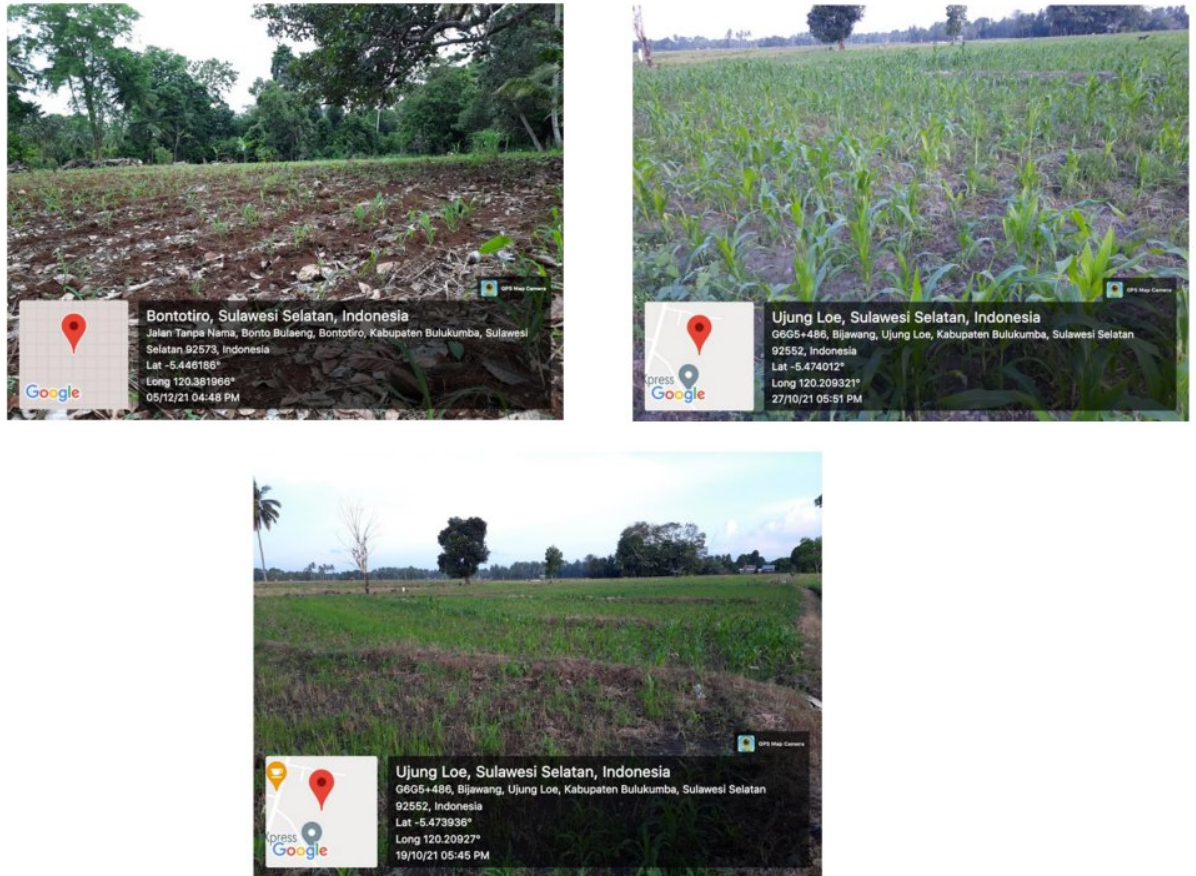
Gambar 8. Lokasi survey.