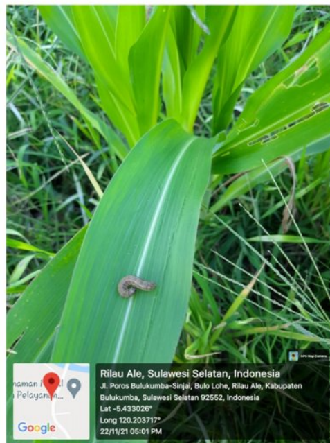
Gambar 10. Pengamatan populasi S. frugiperda .