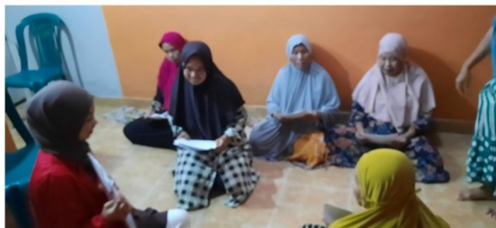
Gambar 11. Dokumentasi wawancara responden.