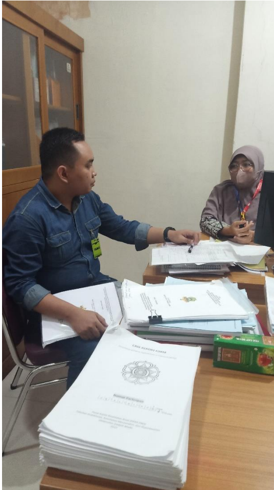
(wawancara dengan staff administrasi diklit RSUP.Dr. Wahidin Sudirohusodo)