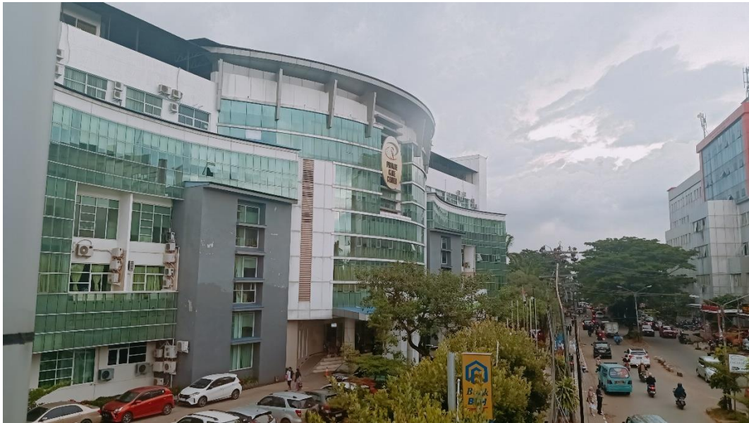
Gedung Private Care Center