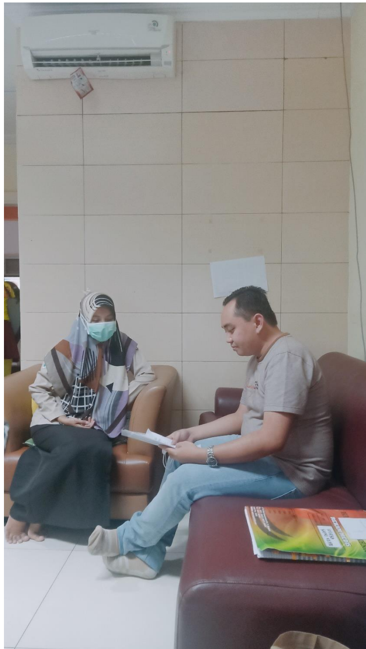
Wawancara dengan perawat di RSUP Dr. Wahidin Sudirohusodo