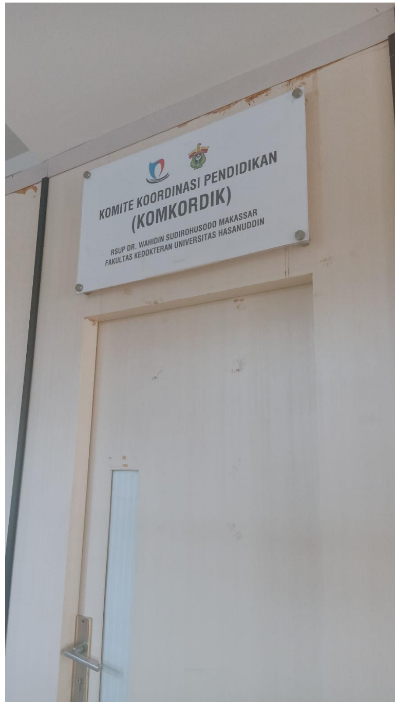
Ruangan Komkordik RSUP. Dr. Wahdin Sudirohusodo