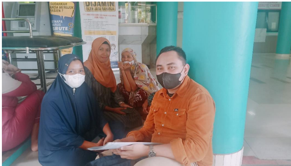
Wawancara dengan pasien Pengguna layanan BPJS Kesehatan