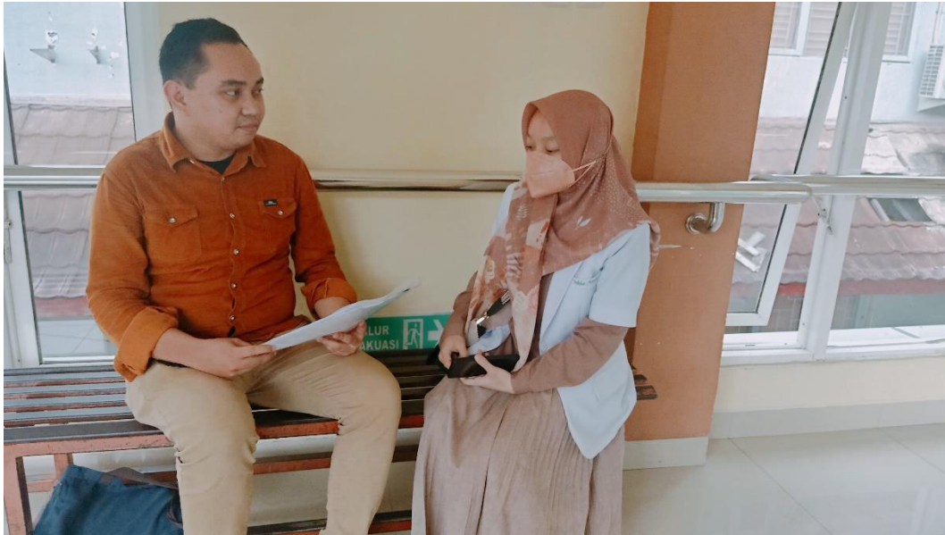
Wawancara dengan Dokter di RSUP Dr. Wahidin Sudirohusodo