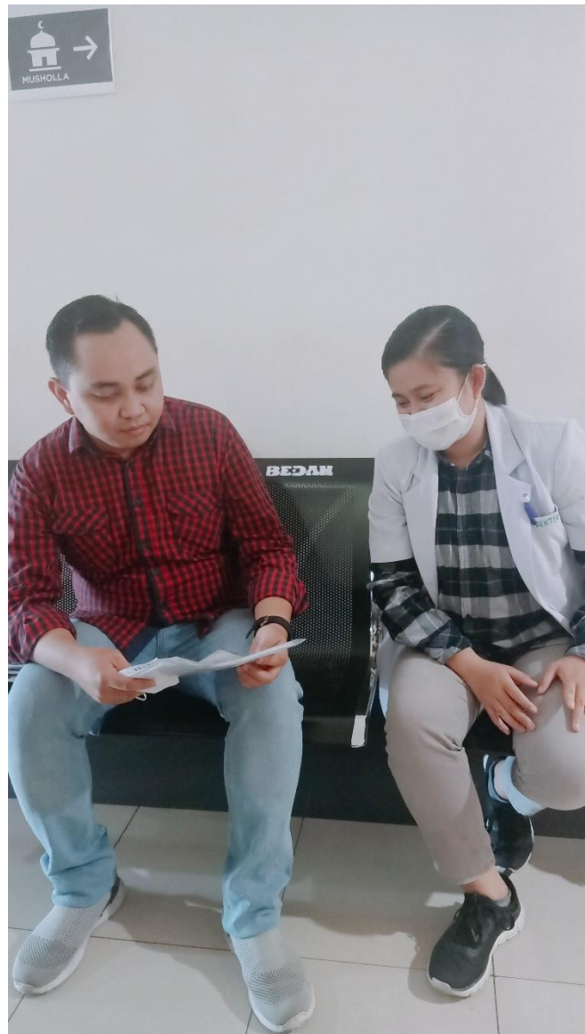
Wawancara dengan Dokter di RSUP Dr. Wahidin Sudirohusodo