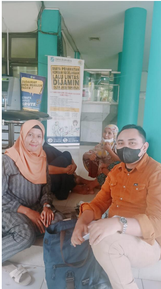
Wawancara dengan pasien pengguna layanan BPJS Kesehatan