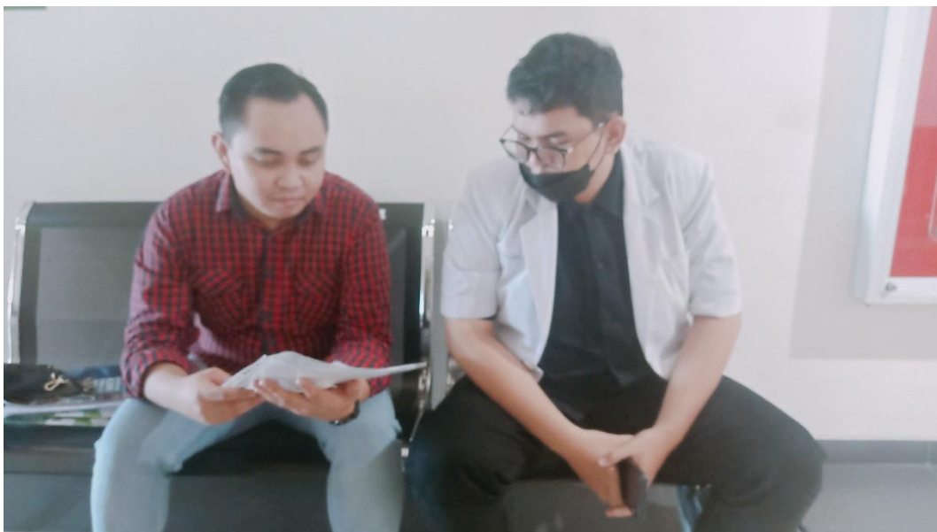
Wawancara dengan Dokter di RSUP Dr. Wahidin Sudirohusodo