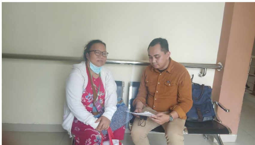
Wawancara dengan pasien rawat inap Pengguna layanan BPJS Kesehatan