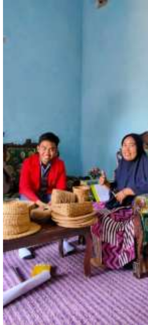
Gambar 7.1 Wawancara Bersama Informan SM