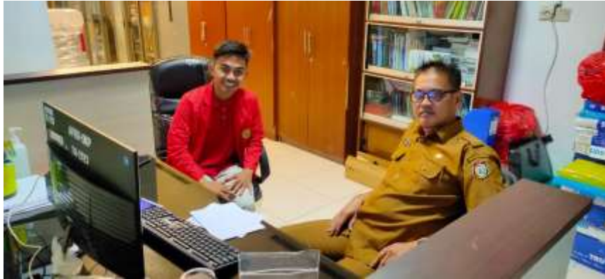
Gambar 7.6 Wawancara Bersama Informan FA