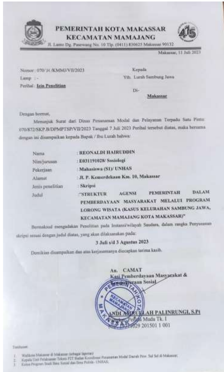
Gambar 7. 8 Wawancara Bersama Informan SA