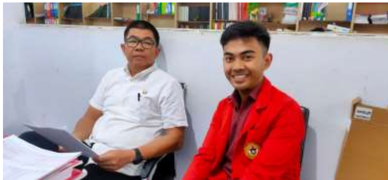
Gambar 7.4 Wawancara Bersama Informan NS