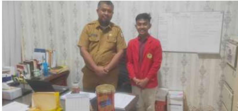
Gambar 7.7 Wawancara Bersama Informan SA