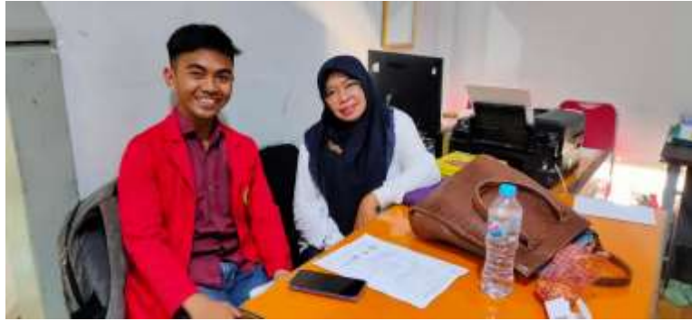
Gambar 7.3 Wawancara Bersama Informan AR