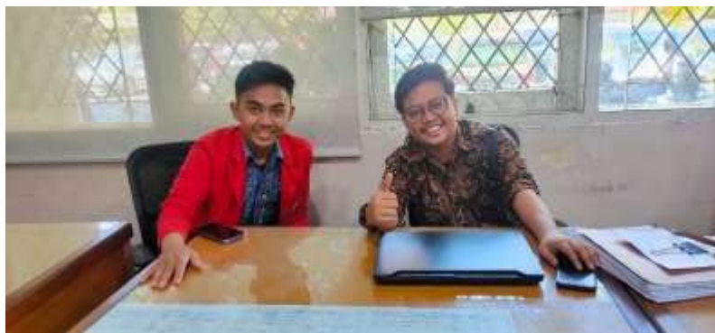
Gambar 7.5 Wawancara Bersama Informan MYN