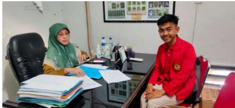
Gambar 7.2 Wawancara Bersama Informan ID