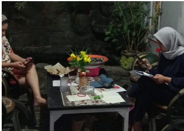
Gambar 5 : Pengisian Kuesioner Penelitian