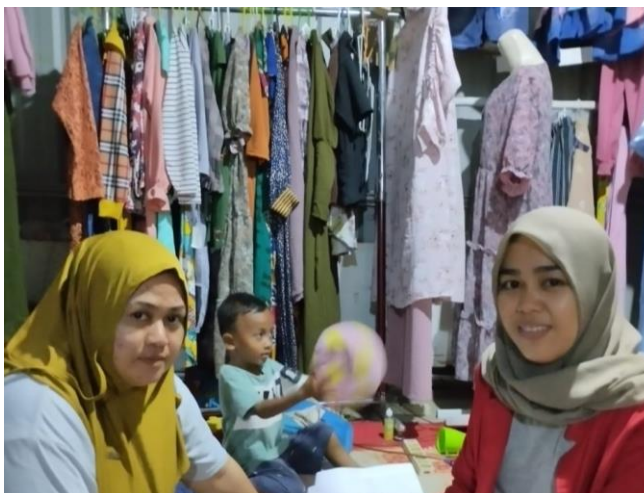
Gambar 6 : Pengisian Kuesioner Penelitian