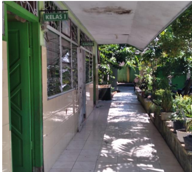
Gambar 1 : SD Inpres Kera-kera