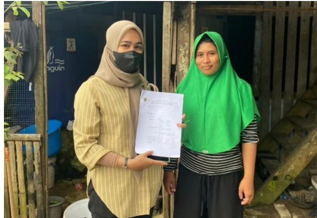
Gambar 4 : Pengisian Kuesioner Penelitian