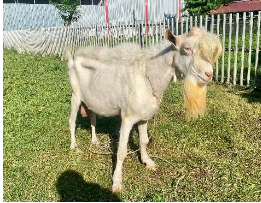
Gambar 1. Kambing Saanen