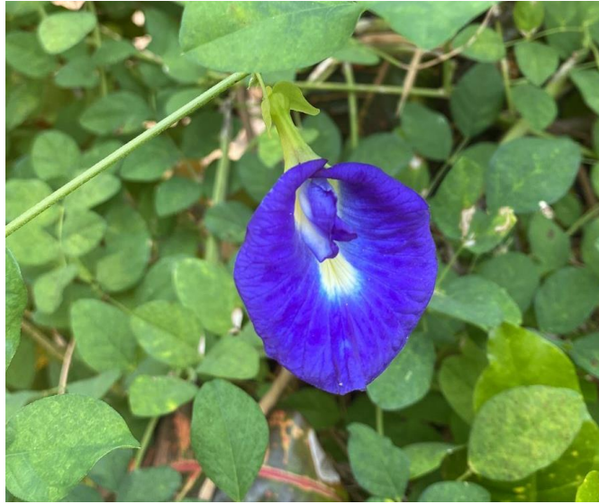
Gambar 2. Bunga Telang ( Clitoria ternatea L. )

Bunga telang ( Clitoria ternatea L. ) sering disebut juga sebagai butterfly pea atau merupakan bunga yang khas dengan kelopak tunggal berwarna ungu, biru, merah muda (pink) dan putih. Kandungan antosianin pada bunga telang dapat diperoleh dengan cara ekstraksi. Kandungan bunga telang diantaranya adalah tanin, saponin, fenol, triterpenoid, alkaloid, flobatanin, dan flavonoid. Kandungan flavonoid bunga telang merupakan senyawa metabolit sekunder yang berkhasiat sebagai antioksidan, selain itu kandungan flavonoid berpotensi sebagai antioksidan dikarenakan adanya gugus hidroksil ( -OH ) atau gugus fungsi dengan satuatom hidrogen dan satu atom oksigen (Budiasih, 2017). Antosianin merupakan salah satu golongan senyawa flavonoid yang memiliki sifat mudah terdegradasi oleh lingkungan seperti pH lingkungan dan oksigen. Kandungan senyawa fitokimia yang terdapat pada bunga telang lainnya seperti triterpenoid, flavonoid, kuinon, polifenolat, saponin, dan steroid ini bekerja secara sinergis sehingga dapat menghambat pertumbuhan bakteri (Turang dkk., 2023).