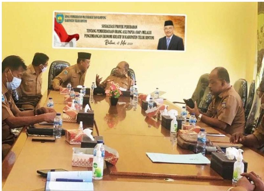
Diskusi Tentang Pemberdayaan OAP