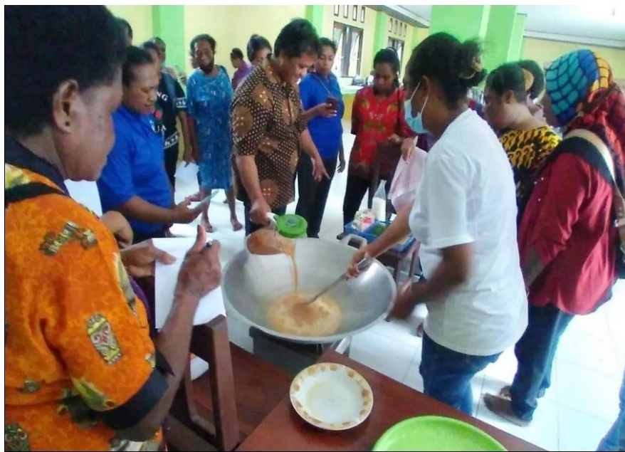
Aktivitas Mama-mama OAP