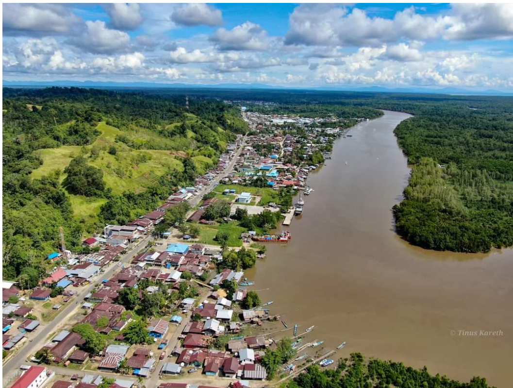
Kota Bintuni Ibu Kota Kabupaten Teluk Bintuni