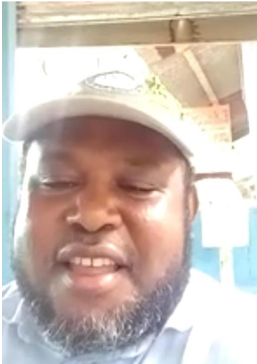
Nuh Inay Sekretaris LMA Sebyar