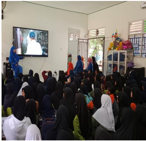
(Projek keluarga cemara)