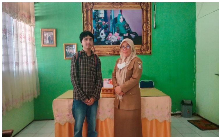
(Bersama Kepala UPT SPF SMPN 15 Makassar)