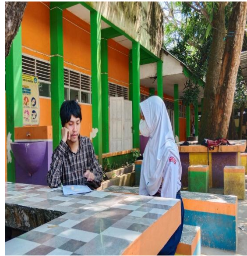
(Pengumpulan data primer dari responden)