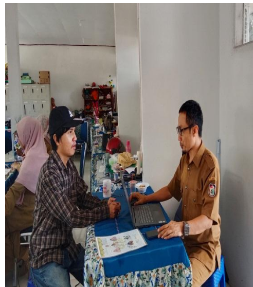
(Pengumpulan data primer dari informan)