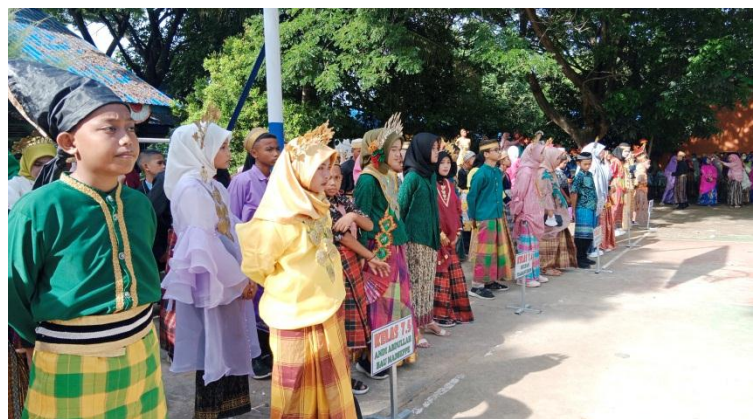
(Kegiatan perayaan hari budaya)