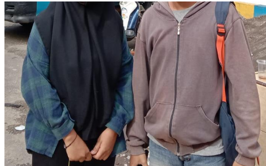
(Wawancara tatap muka)