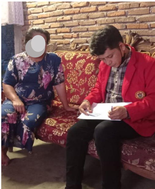
Wawancara pada responden untuk pengisian kuesioner