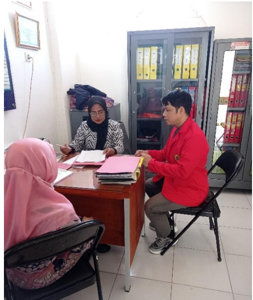
Pengambilan data Penderita Hipertensi di Puskesmas Barombong