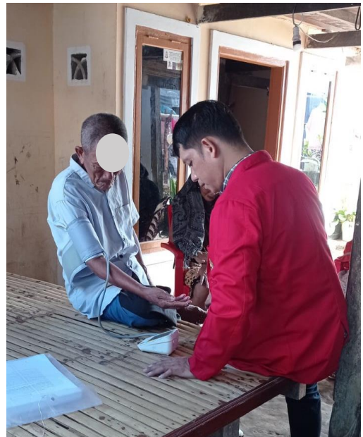
Pengukuran tekanan darah pada responden