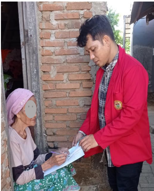
Pengisian Informed Consent oleh responden