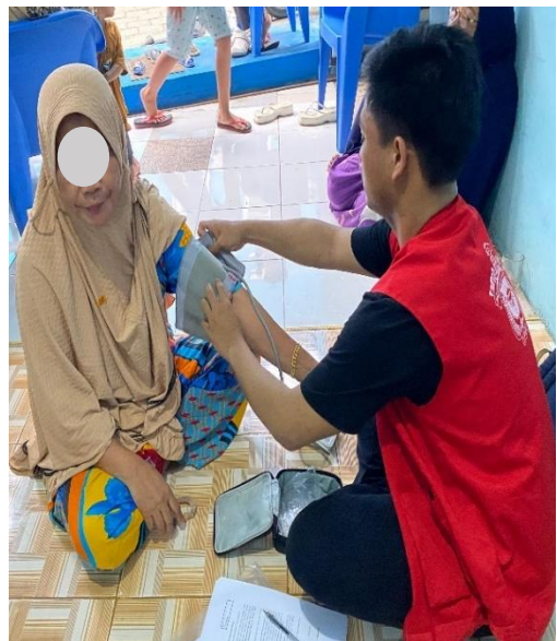
Pengukuran tekanan darah pada reponden