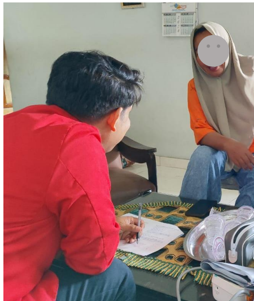
Wawancara pada responden untuk pengisian kuesioner