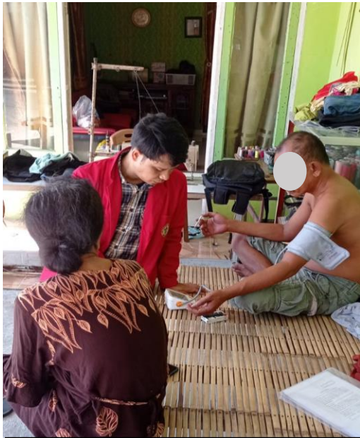
Pengukuran tekanan darah pada responden