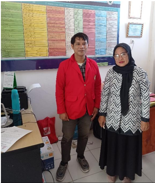
Foto Bersama Kepala Tata Usaha Puskesmas Barombong