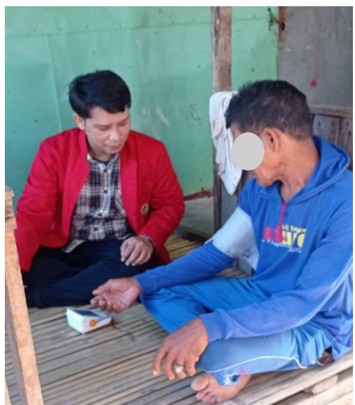
Pengukuran tekanan darah pada responden