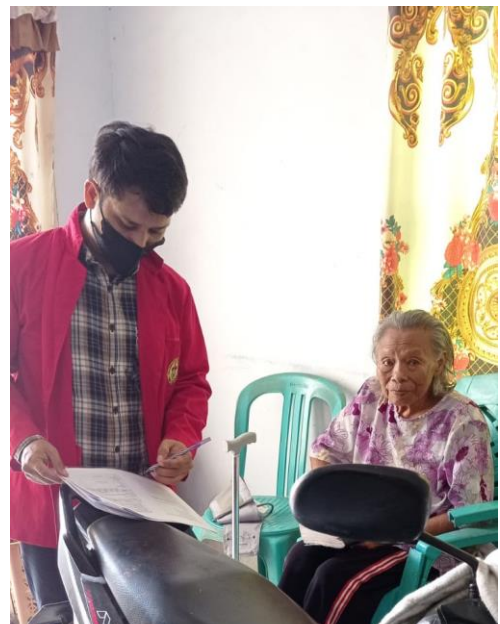
Pengisian Informed Consent oleh responden