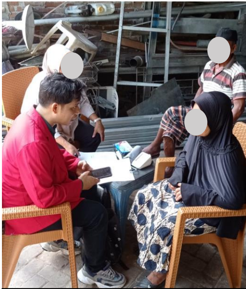
Wawancara pada responden untuk pengisian Kuesioner