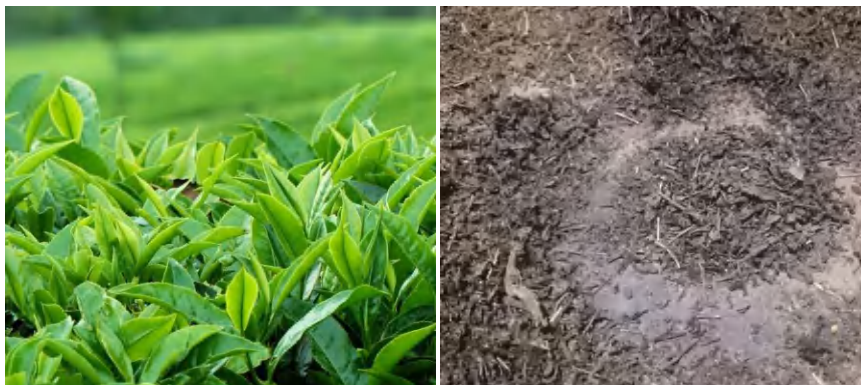
umber: Tea Production Meets 29 Percent of Domestic Demand dan dokumentasi pribadi