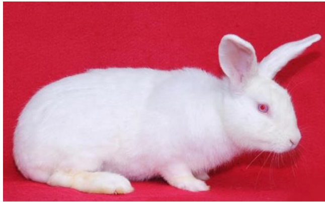
Gambar 1. Kelinci New Zealand White (Priyatna, 2011).

Kelinci ini berasal dari negara New Zealand seperti dengan namanya. Kelinci ini merupakan kelinci yang sering dipakai sebagai kelinci pedaging dan hewan laboratoris dengan bobot rata-rata 8-12 pon. Kelinci New Zealand merupakan hasil persilangan antara Flemish Giant dan Belgian Hare . Kelinci ini memiliki ciri-ciri badan yang berukuran medium dan terlihat bundar, dadanya penuh dan berisi, kaki depannya agak pendek, kepalanya besar dan agak bundar, telinganya agak besar dan tebal dengan ujung yang agak membulat, bulunya halus, tebal dan berwarna putih. (Hermawan et al. , 2016).