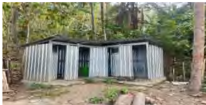
Toilet Umum di Pantai Batunggulung