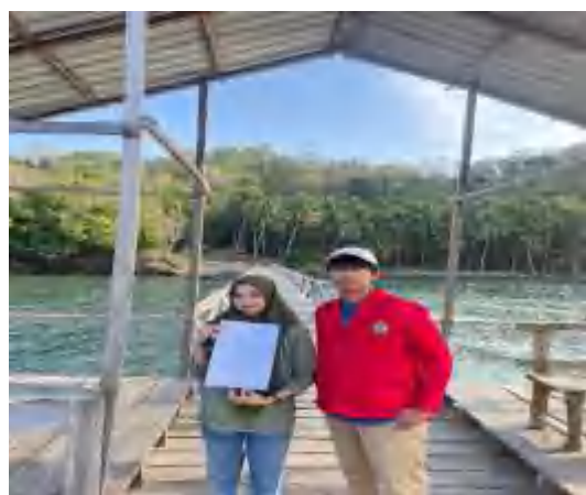
Foto Bersama Responden