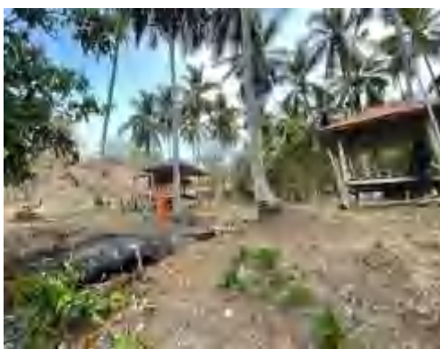
Gazebo pantai batunggulung