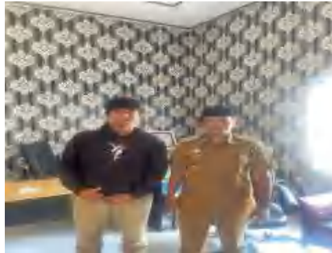
Foto Bersama kepala desa dan meminta izin penelitian kepada kepala desa batunggulung