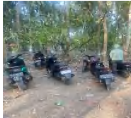
Parkiran Pantai Batunggulung