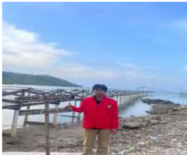
Jembatan wisata Pantai Batunggulung