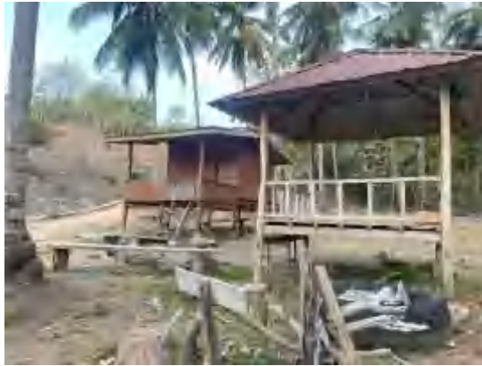
Pos keamanan wisata Pantai batunggulung