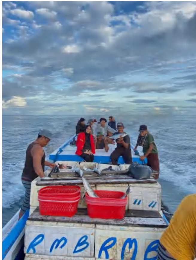
Perjalanan Menuju Tempat Pelelangan Ikan (TPI)