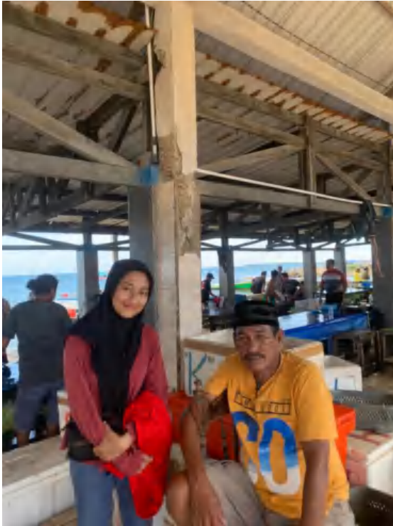
Punggawa Darat, Kallolo