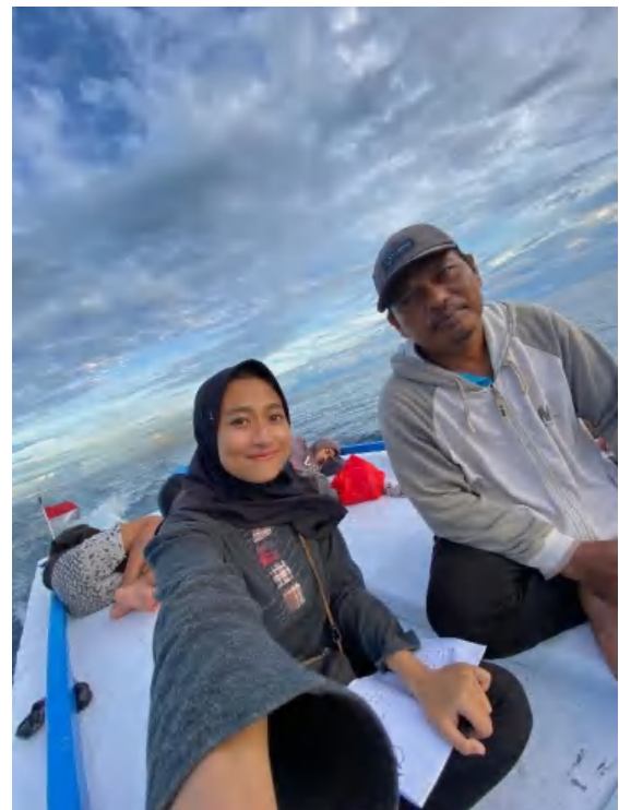
Punggawa Laut, Gustam