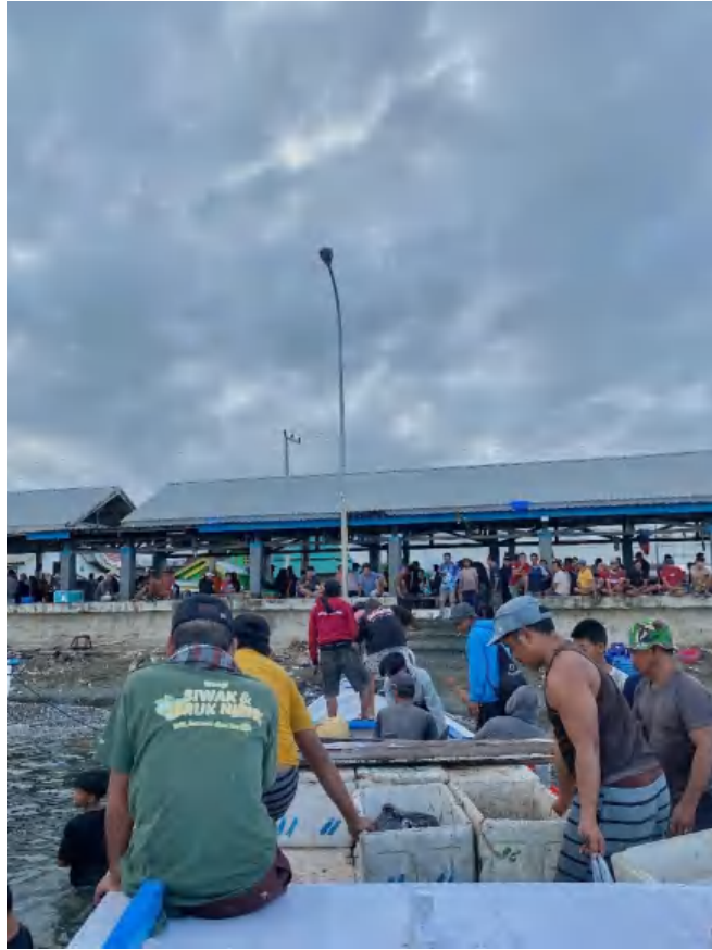
Tiba Di Tempat Pelelangan Ikan (TPI)