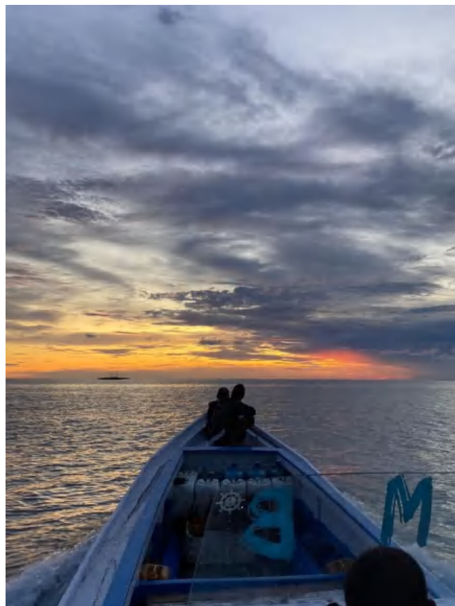
Perjalanan Menuju Lokasi Bagan Rambo