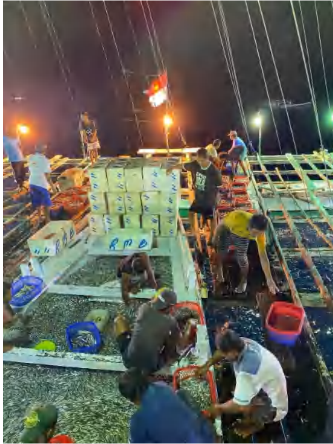
Penyortiran Hasil Tangkapan Bagan Rambo