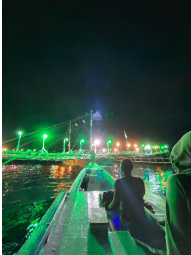
Tiba Di Lokasi Bagan Rambo