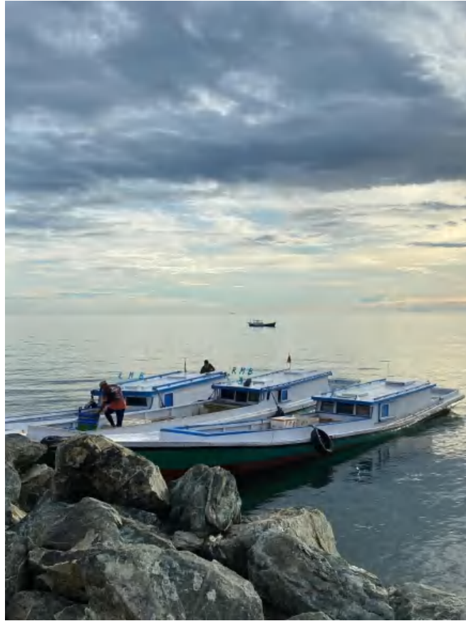
Persiapan Menuju Lokasi Bagan Rambo