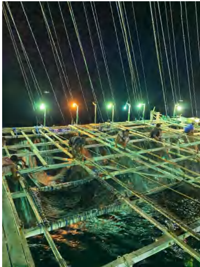
Menarikkan Jaringan atau Hauling Pada Operasi Penangkapan Bagan Rambo