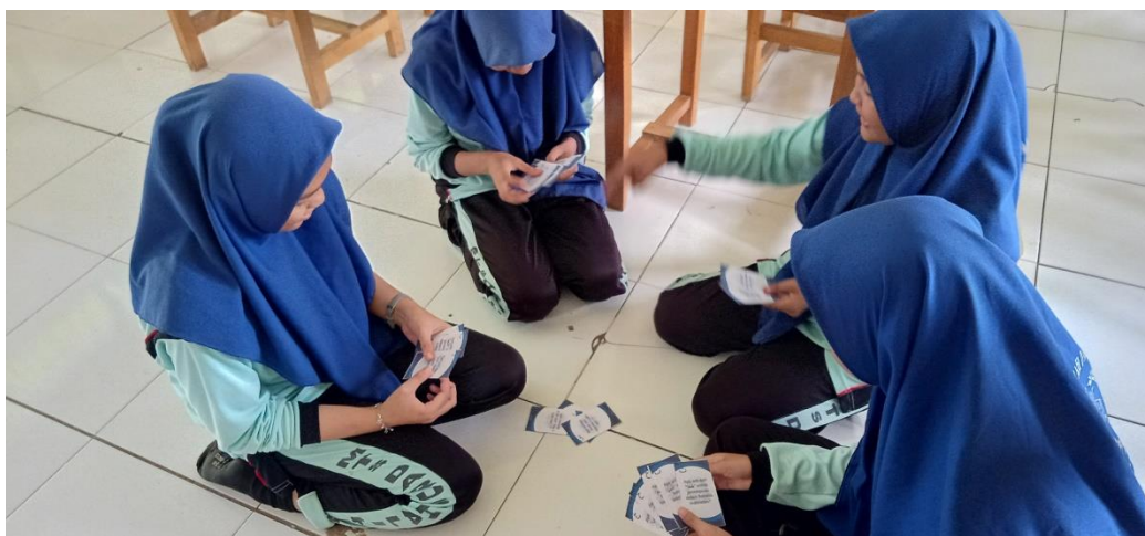
(تطبيق وسائط البطاقة المثيرة في المجموعات)