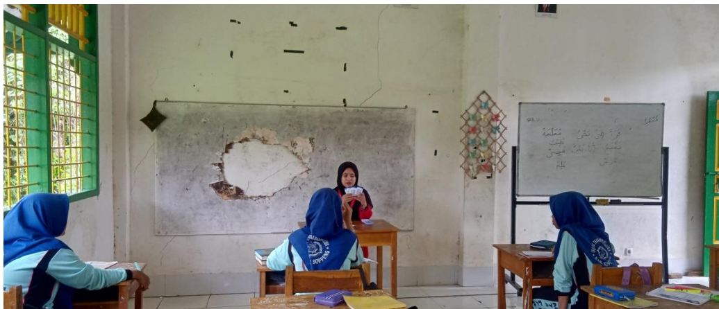
(شرح وسائل (Kartu Seru)