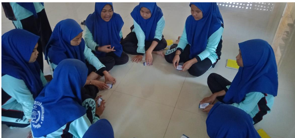
(تطبيق وسائل البطاقة المثيرة في المجموعات)