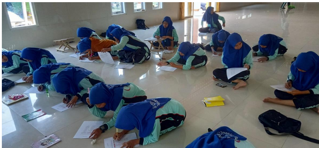
(اختبار الأول/اختبار قبلي قبل تطبيق البطاقات المشوقة في الصف التجريبي)