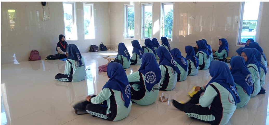
(ورقة عمل الطالب/LKS)