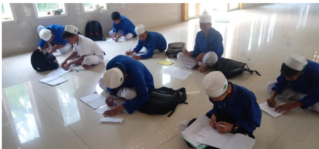
(اختبار الأول/اختبار قبلي قبل تطبيق Kartu Seru في الصف التحكم)