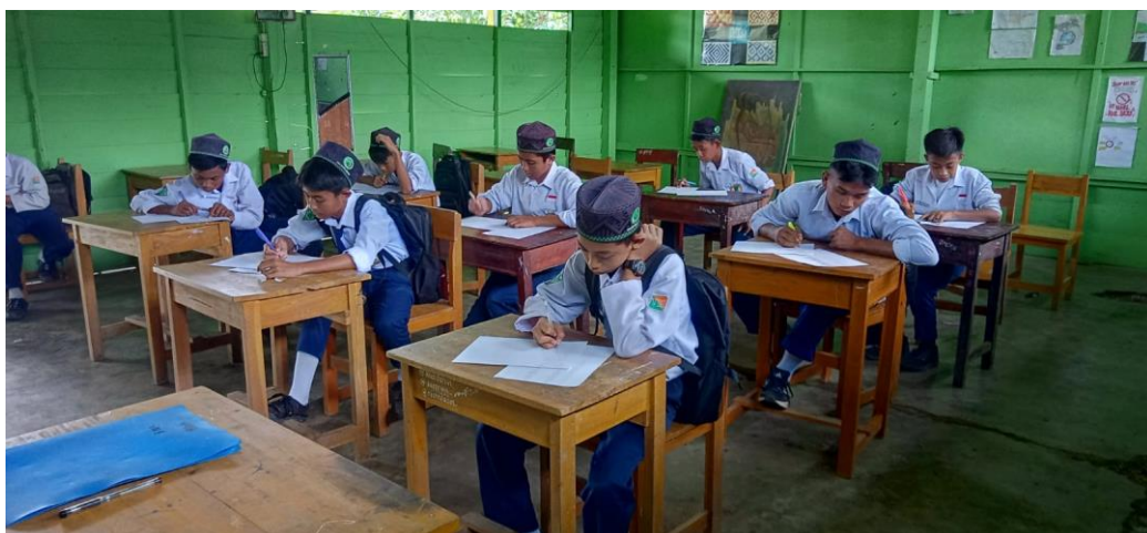
(الاختبار النهائي/الاختبار اللاحق بعد تنفيذ Kartu Seru في الصف التحكيمي)