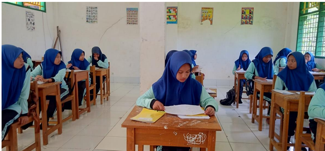
(الاختبار النهائي/الاختبار البعدي بعد تطبيق Kartu Seru في الصف التجريبي)