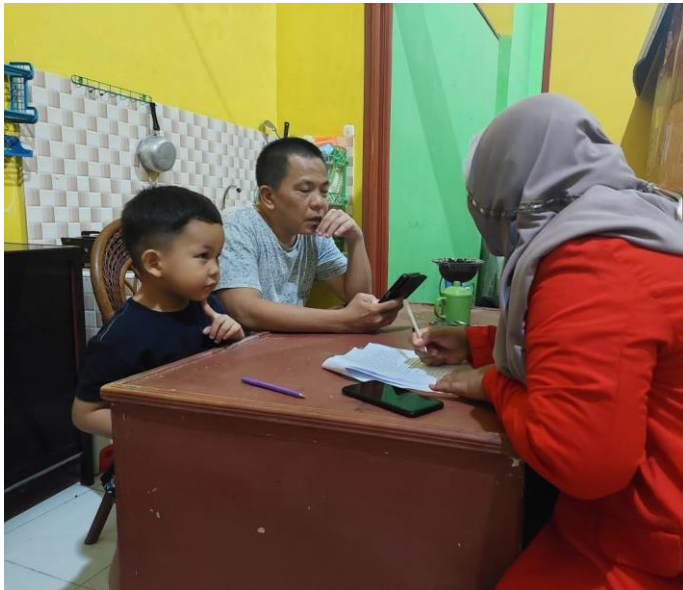
Gambar 7. 2 Wawancara Dengan Informan AT