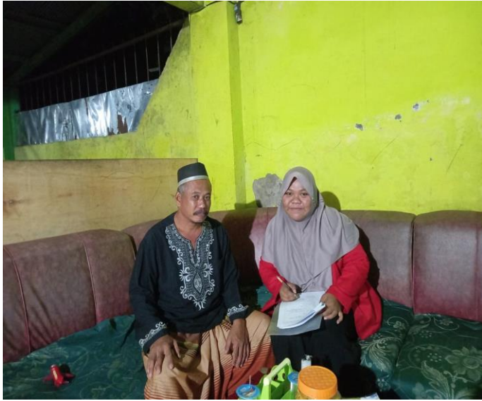
Gambar 7. 1 Wawancara Dengan Informan AJ