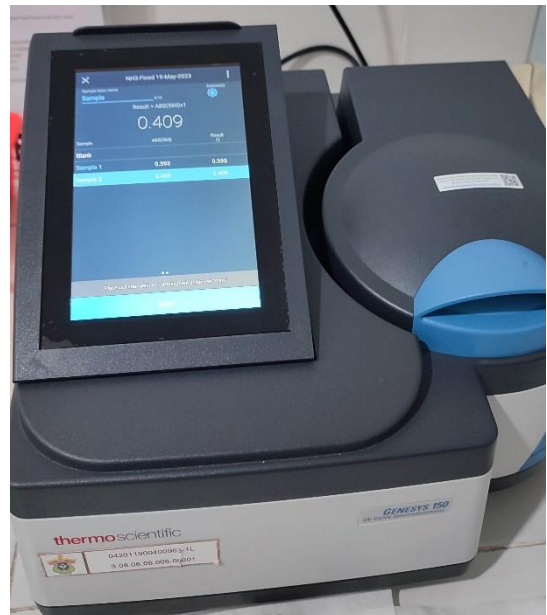
Analisis pada Spektrofotometer