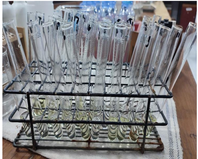
Analisis nitrat di Laboratorium