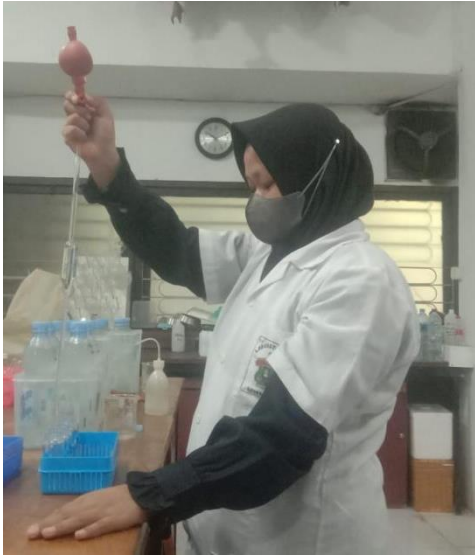
Memipet sampel air di Laboratorium