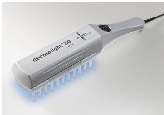
Lampiran 3. Dermalight © 80 (Dr. K. Honle GmbH, Munich, Germany)