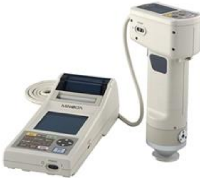
Lampiran 5. Konica Minolta Chromameter Model CR-400®