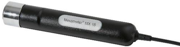
Lampiran 6. Mexameter® MX 18