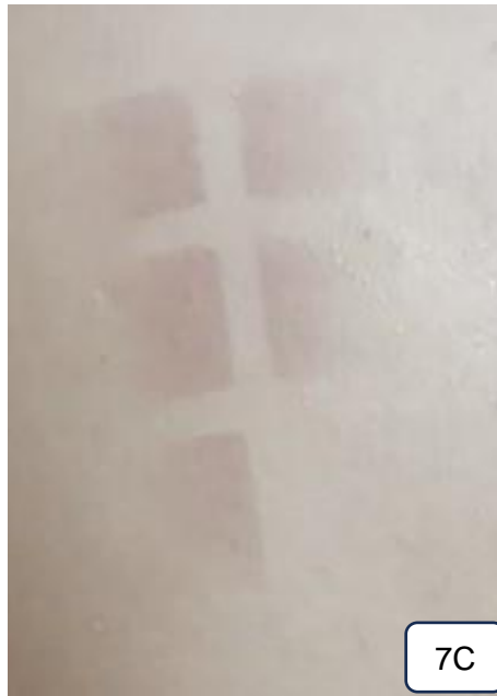
Lampiran 7. Foto klinis subjek penelitian paska 2 MED (7A) kunjungan paska 72 jam