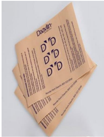
Lampiran 4. Daavlin MEDdose patch (Daavlin company, Ohio, USA)