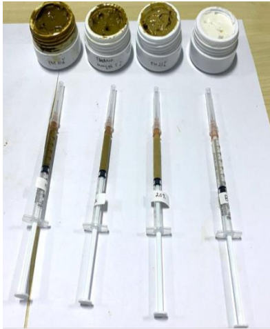
Lampiran 2. Pemberian krim menggunakan spuit 1cc dengan total dosis 10mg/ kotak