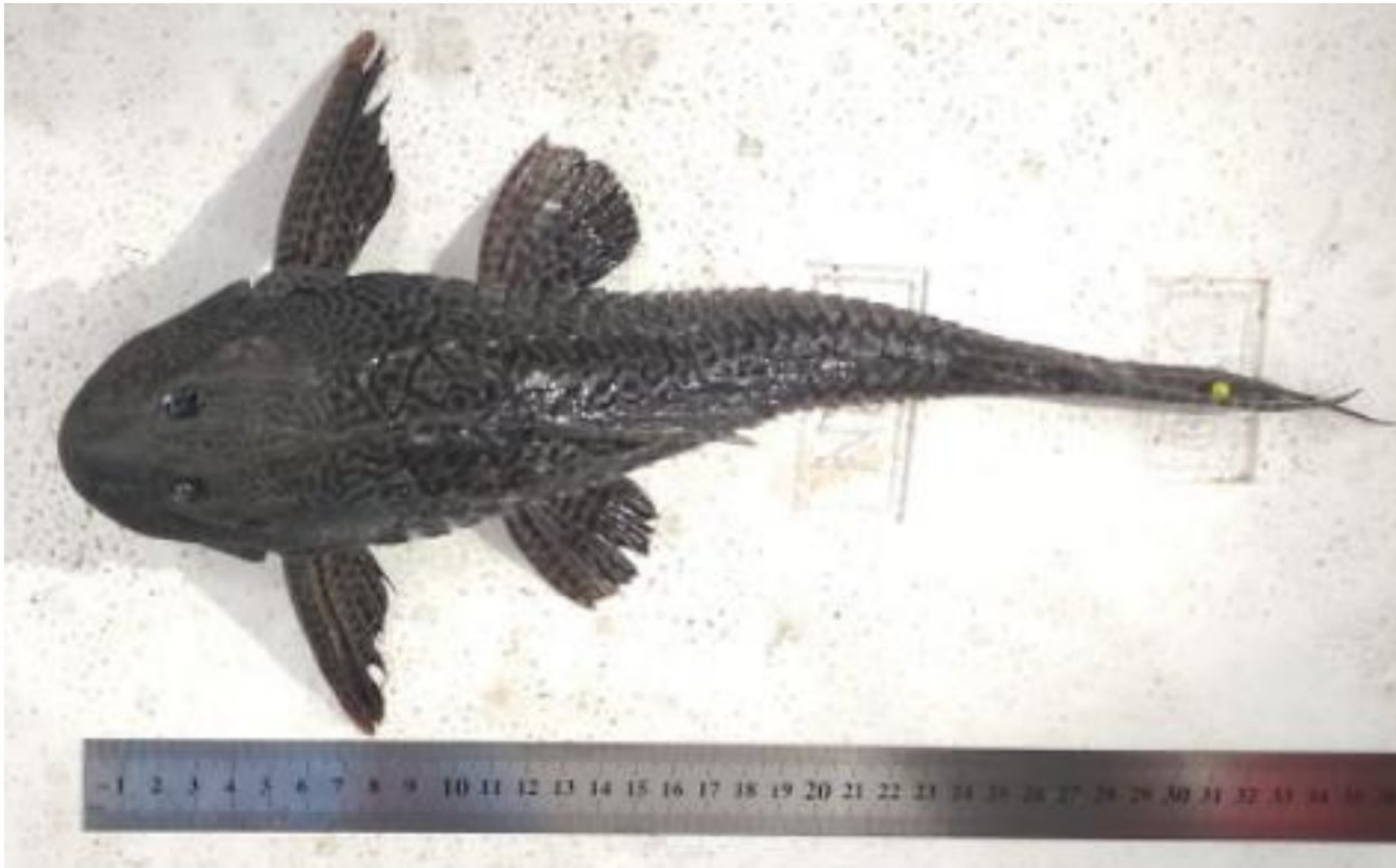
Gambar 1. Ikan sapu-sapu ( Pterygoplichthys pardalis ) yang tertangkap di Danau Sidenreng, Kabupaten Sidenreng Rappang.

membulat. Ekor berbentuk seperti huruf U dan berlekuk ganda. Panjang maksimal dari ikan sapu-sapu spesies Pterygoplichthys pardalis adalah 49 cm (Wahyudewantoro, 2018). Untuk kisaran panjang total dari ikan sapu-sapu spesies Pterygoplichthys multiradiatus di Danau Sidenreng adalah untuk jantan 126 - 440 mm dan untuk betina adalah 150 - 429 mm (Pratiwi, 2018).