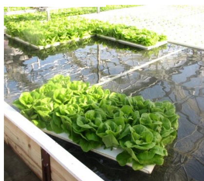
Instalasi Sistem Rakit Apung pada usaha W.S Farm Hidroponik